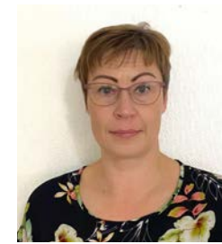
33 Utter Henna KM, upseeri