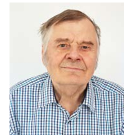
24 Anttas Per maanviljelijä