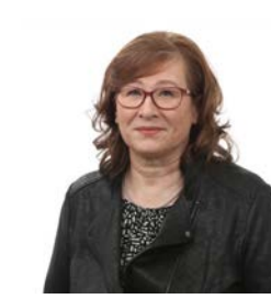
10 Piispa-Jespars Seija yo-merkonomi