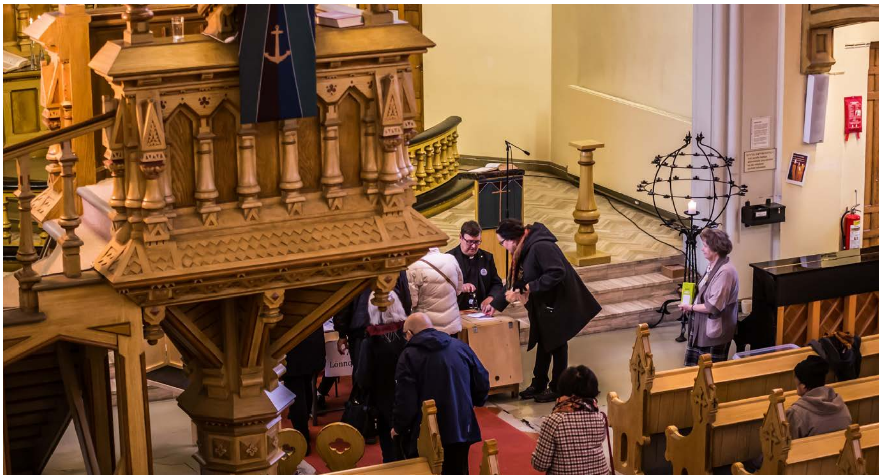
Tänä vuonna Kotkansaaren äänestyspiste varsinaisena vaalipäivänä on Kotkan seurakuntakeskuksella kirkon remontin vuoksi.