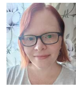
16 Vintervik Sanna henkilökohtainen avustaja