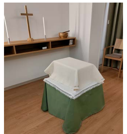
Kotka-Kymin seurakunta tarjoaa arkkupeiton myös pienille vainajille.