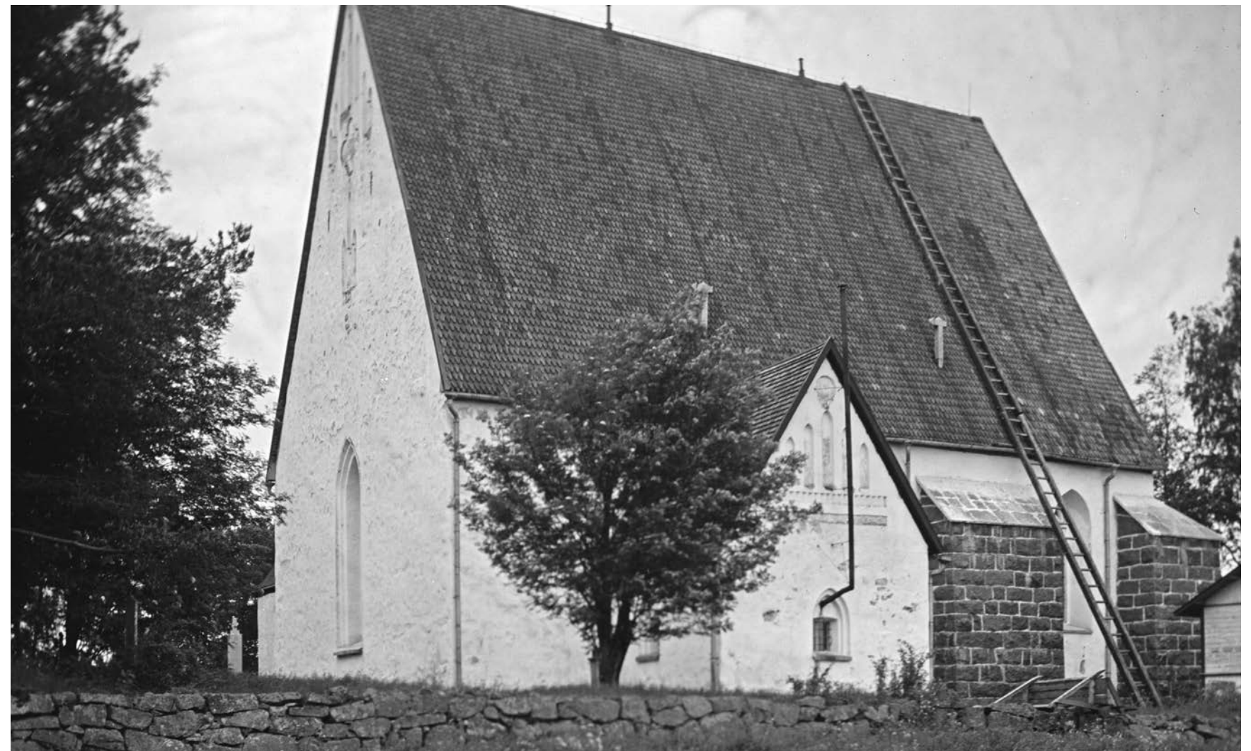
Ensimmäiset tiedot Pyhtään kuudennusmiehistä ovat vuodelta 1620. Kuudennusmiehet muodostivat kirkkoherran kanssa kirkkoneuvoston.

Helilän yhteismuistomerkki sijaitsee entisen kappelin vieressä, sen vasemmallla puolella olevalla nurmialueella.