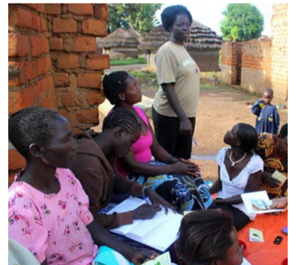
Kirkon Ulkomaanavun säästöryhmässä ugandalaiset naiset opettelivat taloudenpitoa ja säästivät tulevaa ammatinharjoittamista varten.