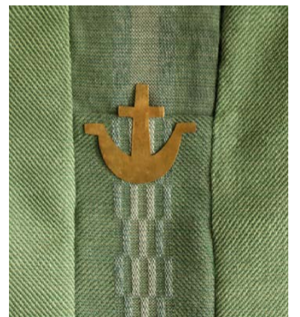
Messukasukan keskikaistaleeseen kiinnitetty hopeisen votiivikorun ankkuri edustaa toivoa.

Langinkosken kirkon uudet kirkkotekstiilit otetaan käyttöön messussa sunnuntai-ina 12.9. klo 10.