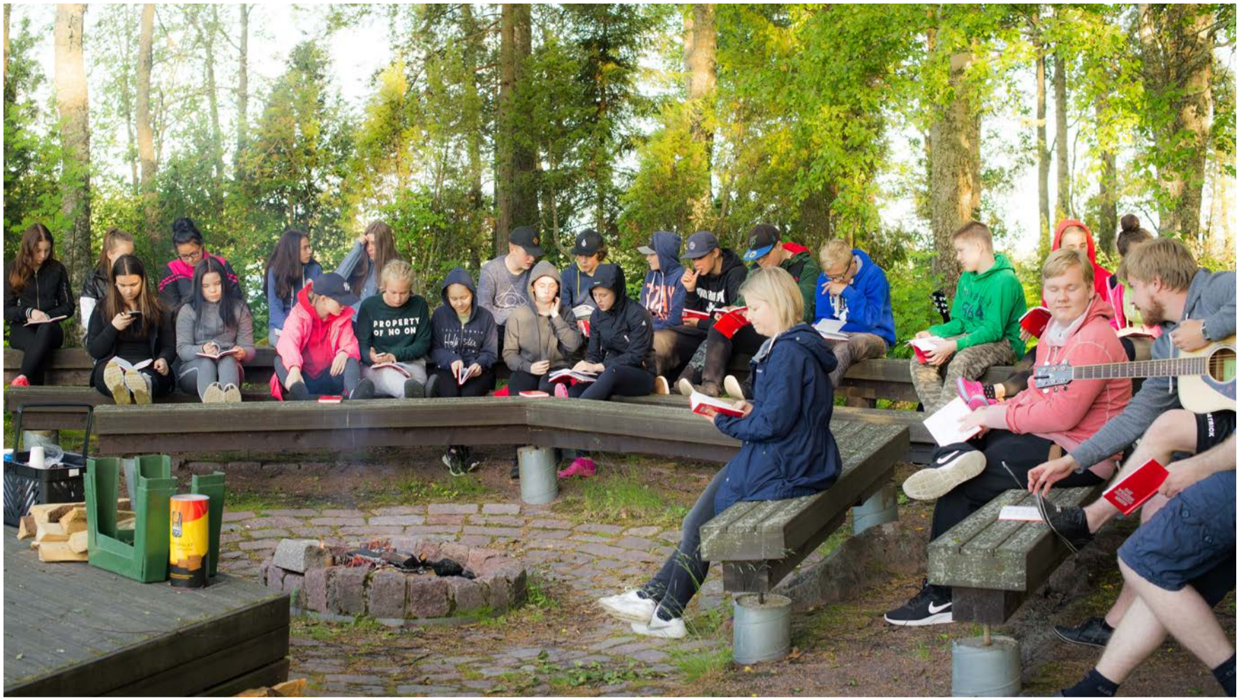
Kesällä 2017 rippikoululeiriläiset Ristiniemessä kokoontuivat iltanuotiolle.