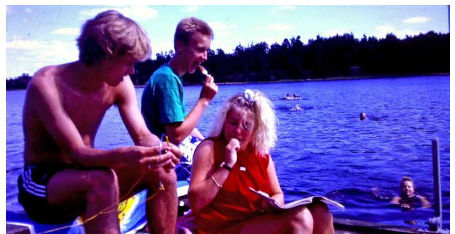
Vuonna 1986 rippileiri Höyterissä.

Ristiniemessä 20 vuotta sitten oli kova ukonilma kesken leirin. Meillä oli juuri käynnissä jokin ruokailu- tai kahvihetki (leirillä syötiin KOKO AJAN), kun salama iski ihan lähelle rakennusta. Joltain taisi pudota tarjotin käsistäkin. Jokin rakennuksen laite sekosi salamaniskusta ja piipitti pitkään.