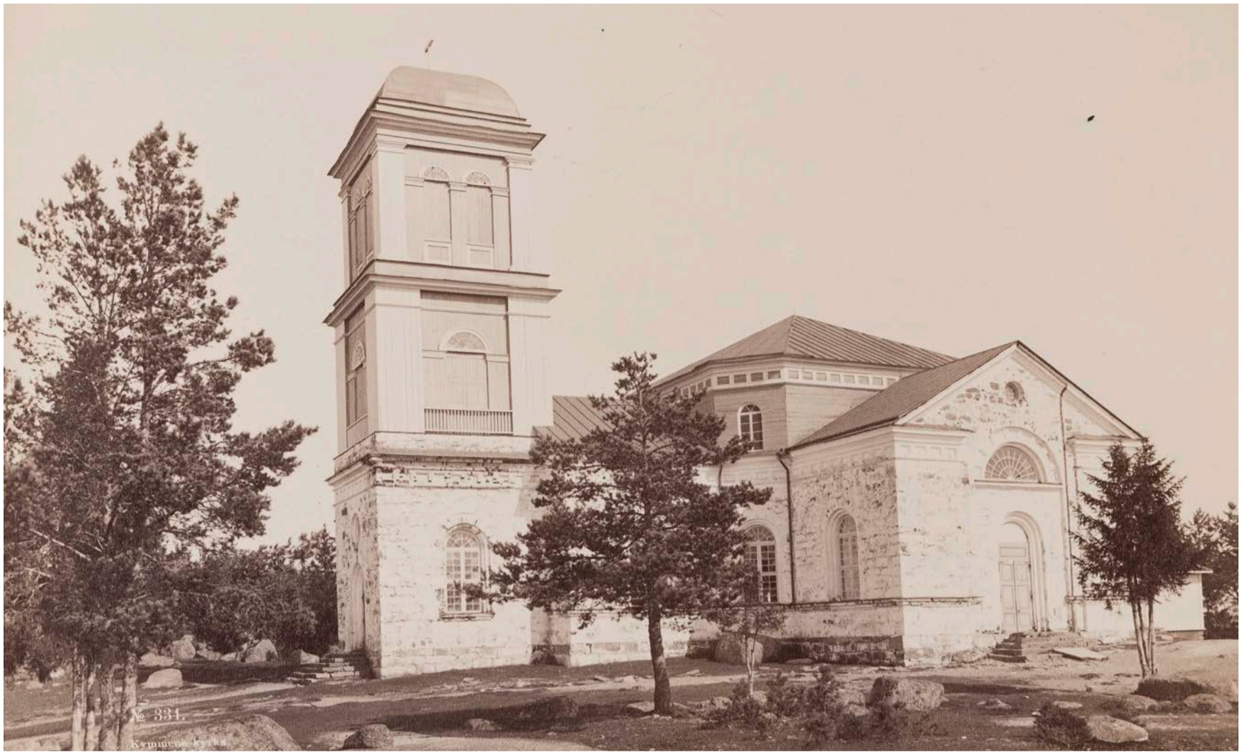
Daniel Nyblin kuvasi Kymin kirkon vuonna 1890. Kuva on Museoviraston historian kuvakokoelmista.