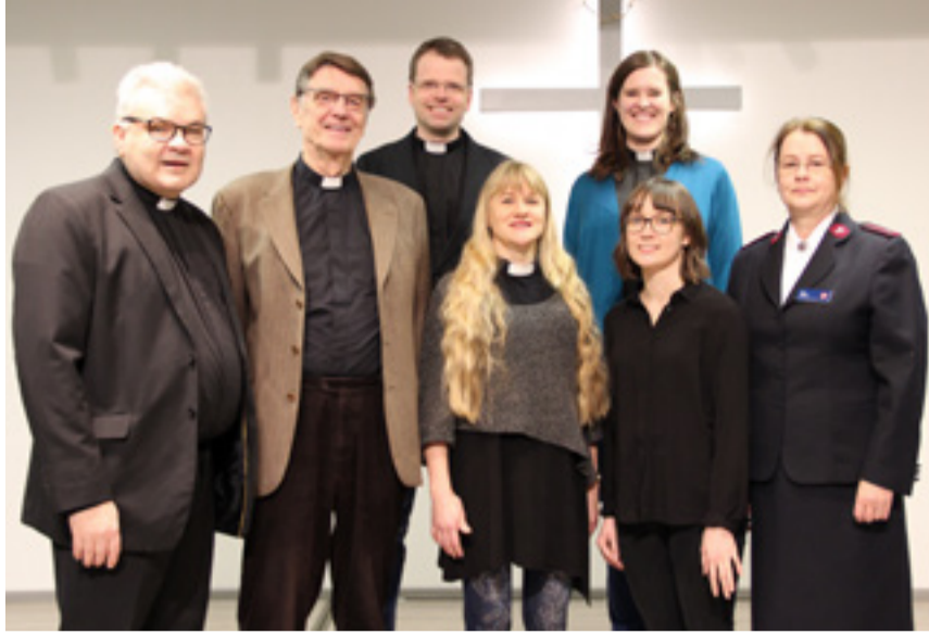
Pastorit Alttarilla -lauluryhmä yhdistää Kotkan alueen eri seurakuntia. Kuva on otettu ryhmän harjoituksissa ennen korona-aikaa.

Sarjassa tutustutaan kirkossa käytettyihin termeihin ja niiden merkityksiin.