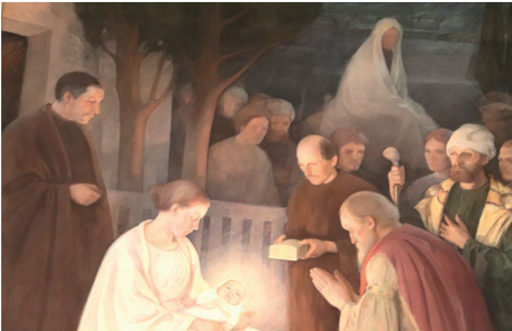
Kotkan kirkon alttaritaulussa Joosef seisoo sivussa, hämärässä vaimonsa Marian takana.