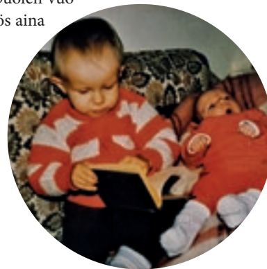
Ensimmäisen jouluni joulukorttikuva, jossa olen yhdessä veljeni kanssa. Kuva on vuodelta 1985.