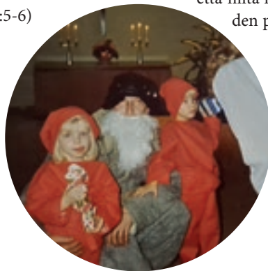
Isäni oli usein joulupukkinä, kuten tässäkin kuvassa. Tässä olemme isäni ja veljeni kanssa partion pikkujouluissa vuonna 1988.