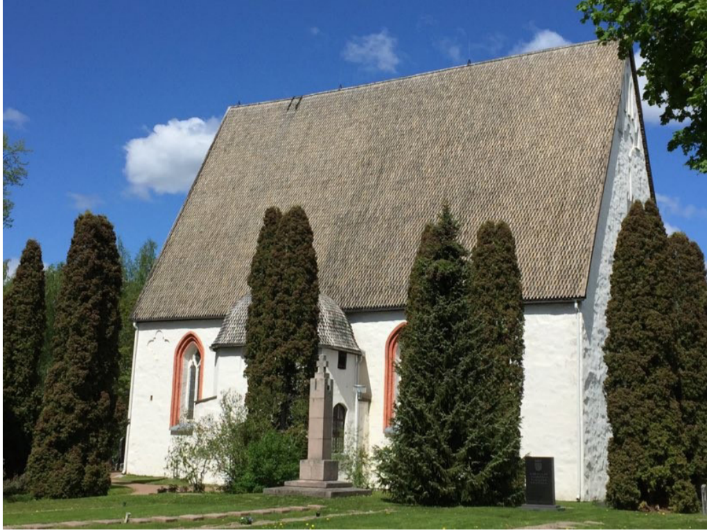
Pyhtään kirkko on omistettu Pyhälle Henrikille, jota katolisella keskiajalla pidettiin maamme suoje- luspyhimyksenä.

Pyhtään kirkko viettää tänä vuonna pientä juhlavuotta, sillä kirkko täyttää 560 vuotta. Ikä lasketaan vuodesta 1460. Tarkka rakennusvuosi ei ole tiedossa. Aikaisemmin Pyhtään kirkkoa ja useita muita keskiaikaisia harmaakivikirkkoja pidettiin selvästi vanhempina.