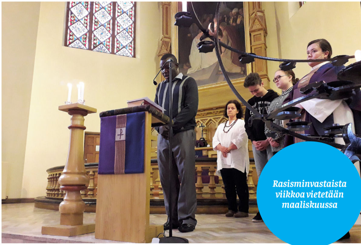
Osana Rasisminvastaista viikkoa vietetään monikulttuurista Maailmojen messua sunnuntaina 22.3. klo 10.

Rasisminvastaista viikkoa vietetään taas maaliskuussa. Tapahtumia ja tempauksia on ympäri Suomen viikolla 12 eli 16.3. alkaen. Myös Kotkassa viikko näkyy monilla kansainvälisillä tapahtumilla.