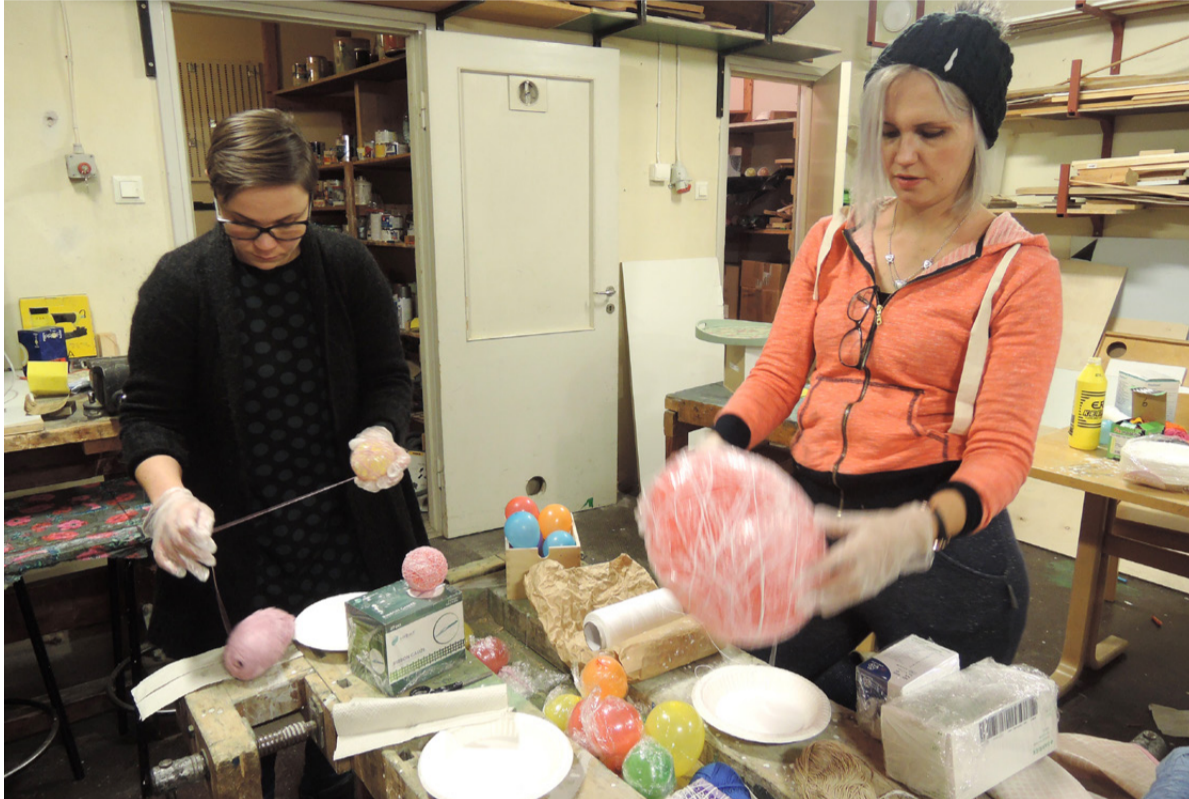
Tuunausklubilla kokeillaan ja tehdään yhdessä, jaetaan kuulumiset ja ideat omiin kädentaitoprojekteihin.

Langinkosken kirkon yläkerrasta kuuluu puheensorina ja nauru. Ovesta sisään astuessa vastaan tulee lämmin tuulahdus. Alkamassa on juuri Kotka-Kymin seurakunnan Tuunausklubi Lentävä Lipasto.