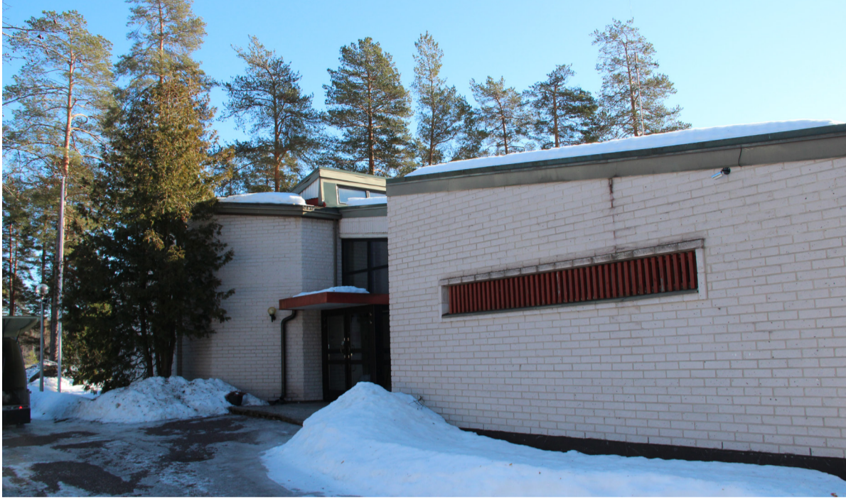
Siltakylän seurakuntatalo on rakennettu 1980-luvulla. Rakennus on tullut käyttökänsä päähän.

Pyhtään seurakunnan Siltakylän seurakuntatalo on rakennettu 1980-luvun alkupuolella. Ilvestie 1:ssä Siltakylässä sijaitsevat seurakuntatalo ja kirkkoherranvirasto ovat tulleet käytännöllisesti katsoen käyttökänsä päähän. Nykyisten rakennusten korjaaminen asianmukaiselle tasolle on todettu kalliiksi ja silti lopputulos olisi ollut epävarma. Seurakuntatalossa on lisäksi toiminnan kannalta tiloja joille ei ole käyttöä.