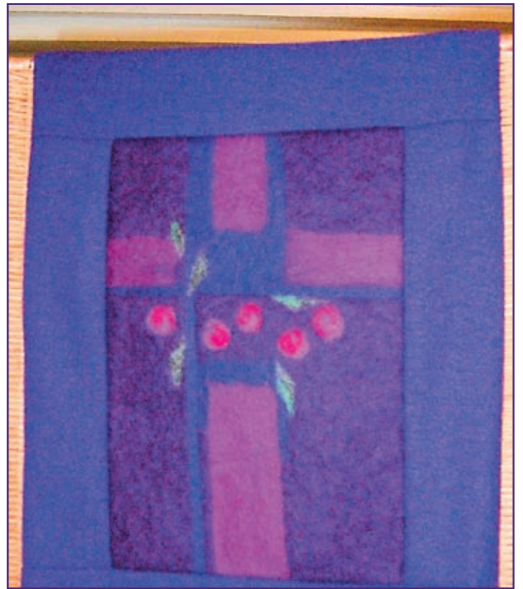
Violettia väriä käytetään kirkossa pääsiäistä edeltävän paaston ja niin sanotun pikkupaaston aikaan, ensimmäistä adventtia seuraavasta maanantaista jouluaattoamuun.

1900-luvun lopulla kirkko otti violetin vaihtoehdoksi sinisen värin. Sininen on eri kulttuureissa taivaan, ilman ja veden väri. Vanhoissa kirkkoissa sinistä on käytetty mm. saarnatuolin katoksessa