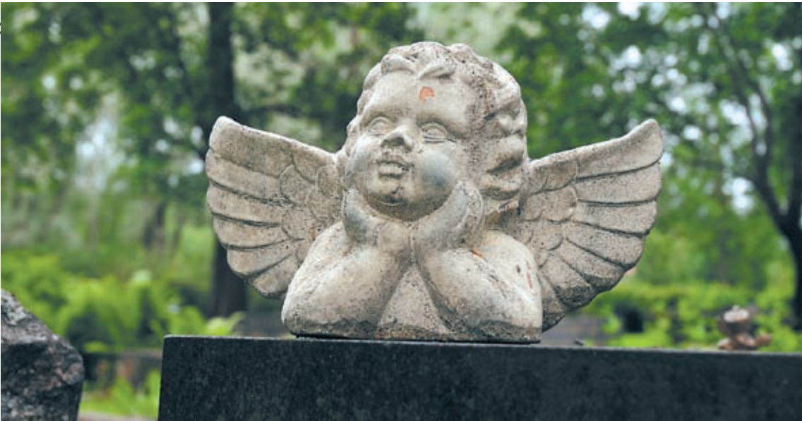
Enkeli haudalla on kaipauksen merkki.