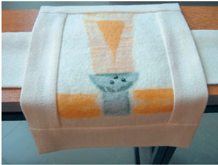
Valkoinen väri on Jeesuksen syntymän, ilosanoman väri. Ruonalan kirkon huovutetussa kirjaliinassa on herkkä koristelu.

Suomessa värien käyttö lopetettiin kuitenkin 1700-luvun lopulla ja siirryttiin mustaan. Saman karun periaatteen mukaan peitettiin vanhojen kirkkojen seinämaalaukset kalkki- ja laastikeroksilla. 1900-luvun alussa kirkossa kiinnostuttiin uudelleen väreistä, mutta vasta 1950-luvulla kirkkoihin alettiin hankkia liturgisten värien mukaisia tekstiilejä. Mallia otettiin Ruotsista ja Englannista.