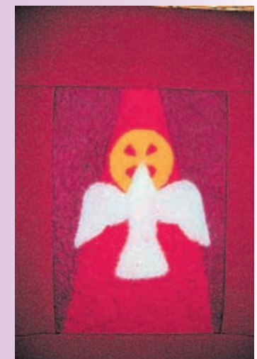
Kirjaliinassa on punaisella pohjalla valkoinen kyyhky.