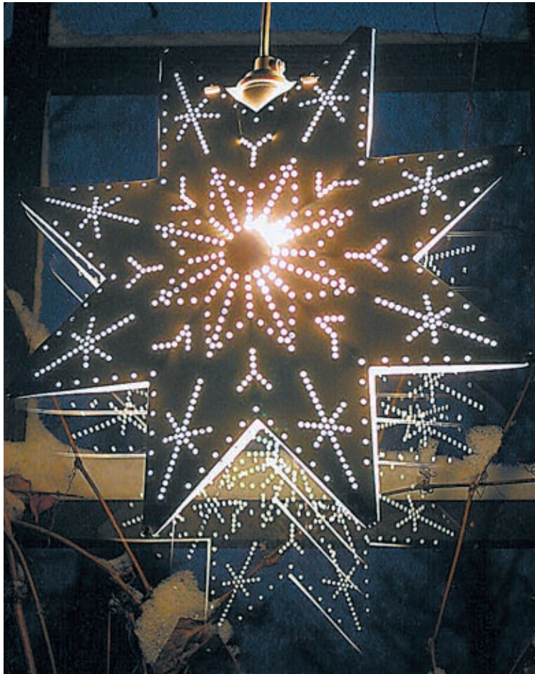
Tähdet tuikkivat pimeyden keskellä monessa rakkaassa joululaulussa.

– Jos saa nimetä vain yhden lempijoululaulun, niin kyllä se on En si valtaa, loistoa. Siinä laulussa on mielestäni kerrottu joulun merkitys ja se, mitä kaikille toivoo: rauhaa, hyvää tahtoa ja uskoa hyvyteen niin koko maailmalle kuin jokaiseen yksittäiseen kotiinkin.