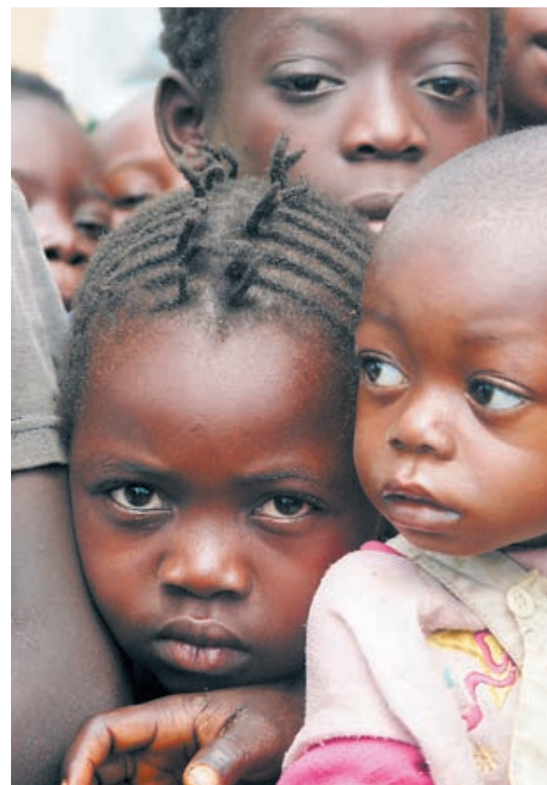
Kun aikuiset taistelevat, lapset kärsivät eniten, myös Kongossa.

Hädässä eläviä kongolaisia lähimmäisiä voi auttaa lahjoittamalla Kirkon Ulkomaanavun tilille Nordea 157230-500504, viite 1070.