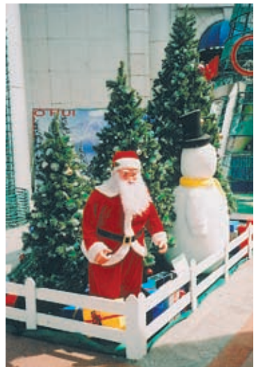
Joulupukki ja lumiukko Ho Chi Minh Cityn Diamond Plaza -tavaratalon nurkalla.

E erityisen vaikuttava oli, kun jouluaattoiltana Ho Chi Minh Cityn kaduille ilmestyivät ihmiset moottoripyörineen. Kaaos oli valtava, sillä kaupungissa riittää muutenkin moottoripyöriä ja skoottereita. Niitä on kaksikymmentä kertaa enemmän kuin autoja.