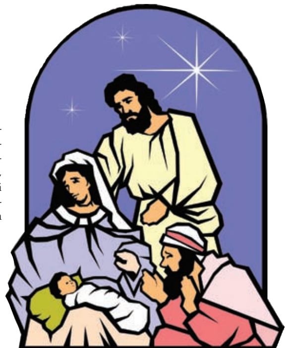
Evankeliumi Luukkaan mukaan 2: 1-20

Paimenet palasivat kiittäen ja ylistäen Jumalaa siitä, mitä olivat kuulleet ja nähneet. Kaikki oli juuri niin kuin heille oli sanottu.