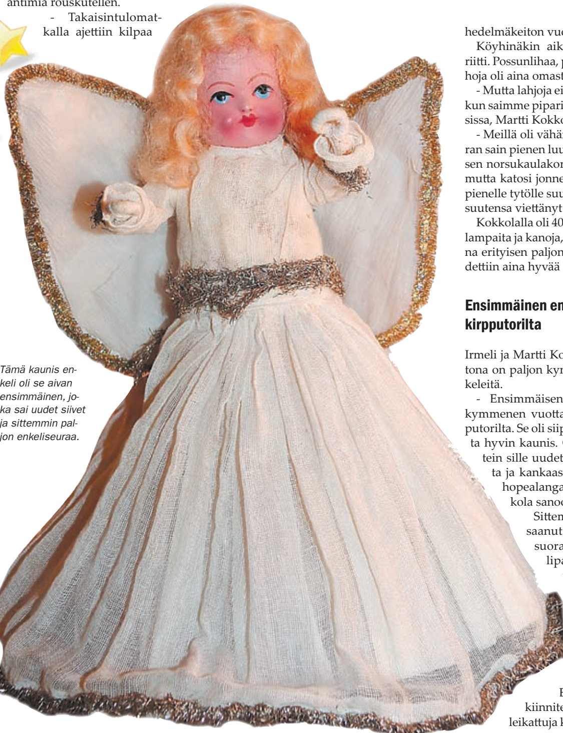
Tämä kaunis enkeli oli se aivan ensimmäinen, joka sai uudet siivet ja sittemmin paljon enkeliseuraa.