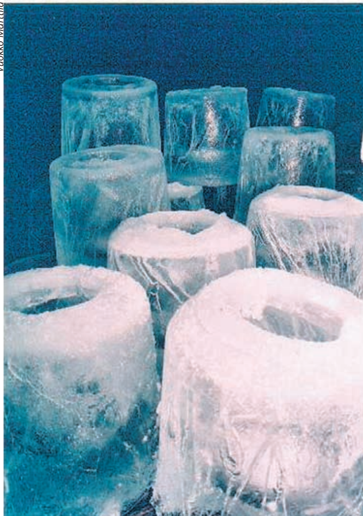
Jäälyhdyt ovat valmiina, ja kohta ne saavat sisälleen kynttilät.

tyy hetkessä kuin tyhjästä muutama sata ihmistä. Toiset tulevat kynttilälyhtyjien kanssa. Sieltä on mukava poiketa hautausmaalle ja sitten joulusaunaan.