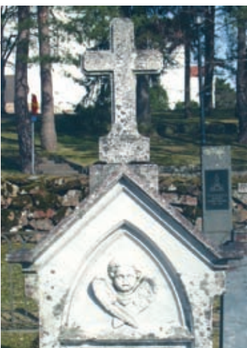
Lapsenkasvoinen enkeli löytyy Kymin Vanhalta hautausmaalta.

ei kristillisen käsityksen mukaan kuitenkaan tapahdu. Ihminen ei kuolemassa vaihda lajia. Enkelit ovat luotuja omaksi joukokseen, kuten ihmiset omakseen ja eläimet samoin.