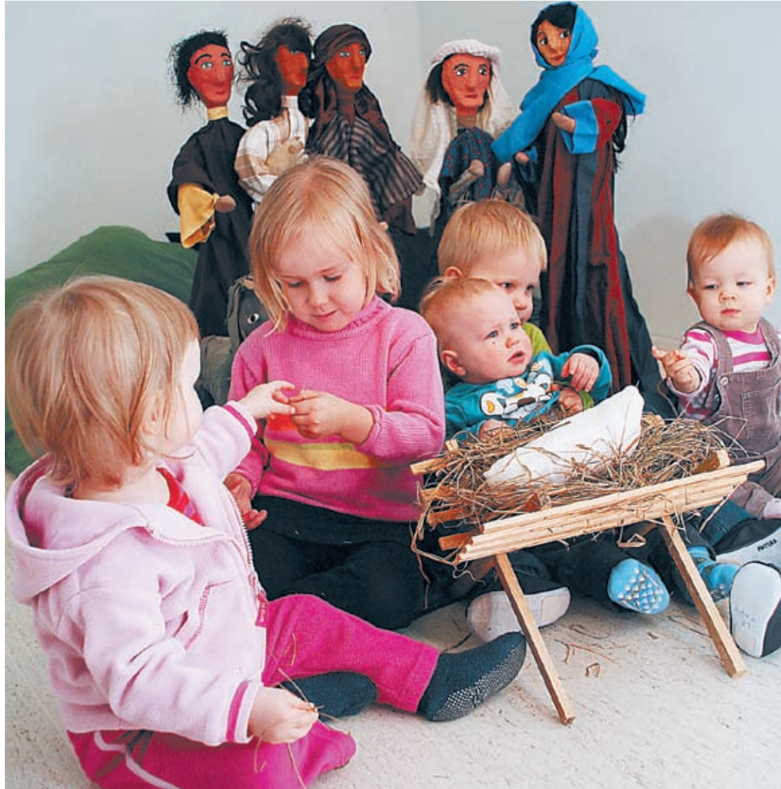
Musapyhiksen lapset pysähtyivät seimen ihmeen äärelle.

tettiin seimiasetelma, oli Rooman Santa Maria Maggiore. Sen seimi vuodelta 1291 sijoitettiin niin, että sen saattoi nähdä vain polvistumalla ja kumartamalla. Seimet alkoivat yleistyä 1300-luvulla, ja 1500-luvulla niitä oli kaikkialla Etelä- ja Keski-Euroopassa. Vähitellen jouluseimet levisivät myös kirkoista koteihin. Lähetystyön myötä jouluseimi tuli suosituksi myös Latinalaisessa Amerikassa ja Afrikassa.