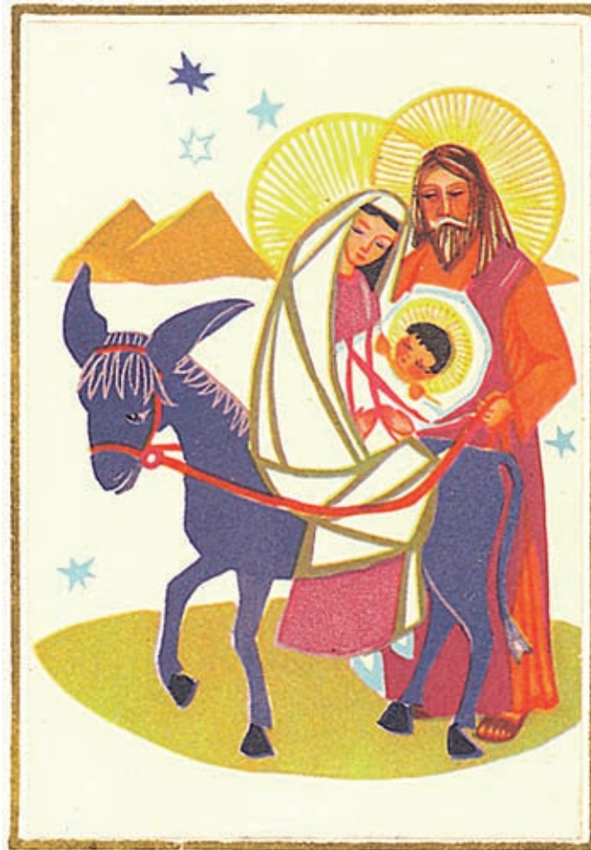
Pako Egyptiin on puolalaisen joulukortin aiheena.

Niinpä suomalaistenkin legendojen mukaan tallirengki Tapani näki ensimmäisenä joulun tähden Betlehemin taivaalla. Tapanin nimi saattoi olla myös Tahvana, Teppo tai Tahvanus. Tapaninpäivänä miehet ko-