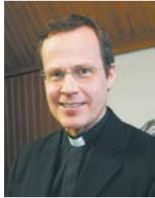
4 Dogmatiikan professori Miikka Ruokanen