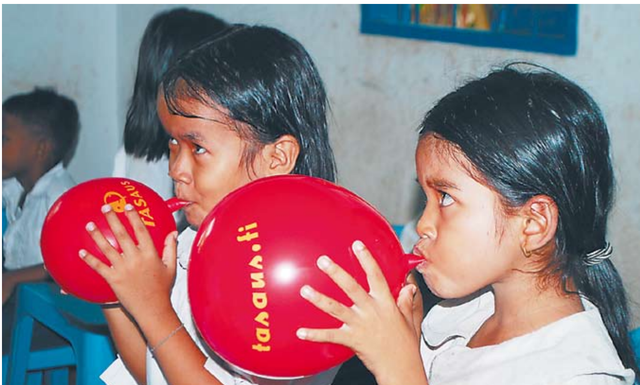
Lapset iloitsevat tasauspalloistaan.