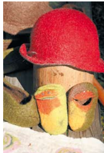
Huovuttamalla tehtiin vaikka Pariisiin kelpaava hattu ja hauskat kännykkäkotelot.

Pussista maksetaan teet, leivät ja juustot ja lopuista kertyy mukavasti rahaa etiopialaisen palkkukseen.