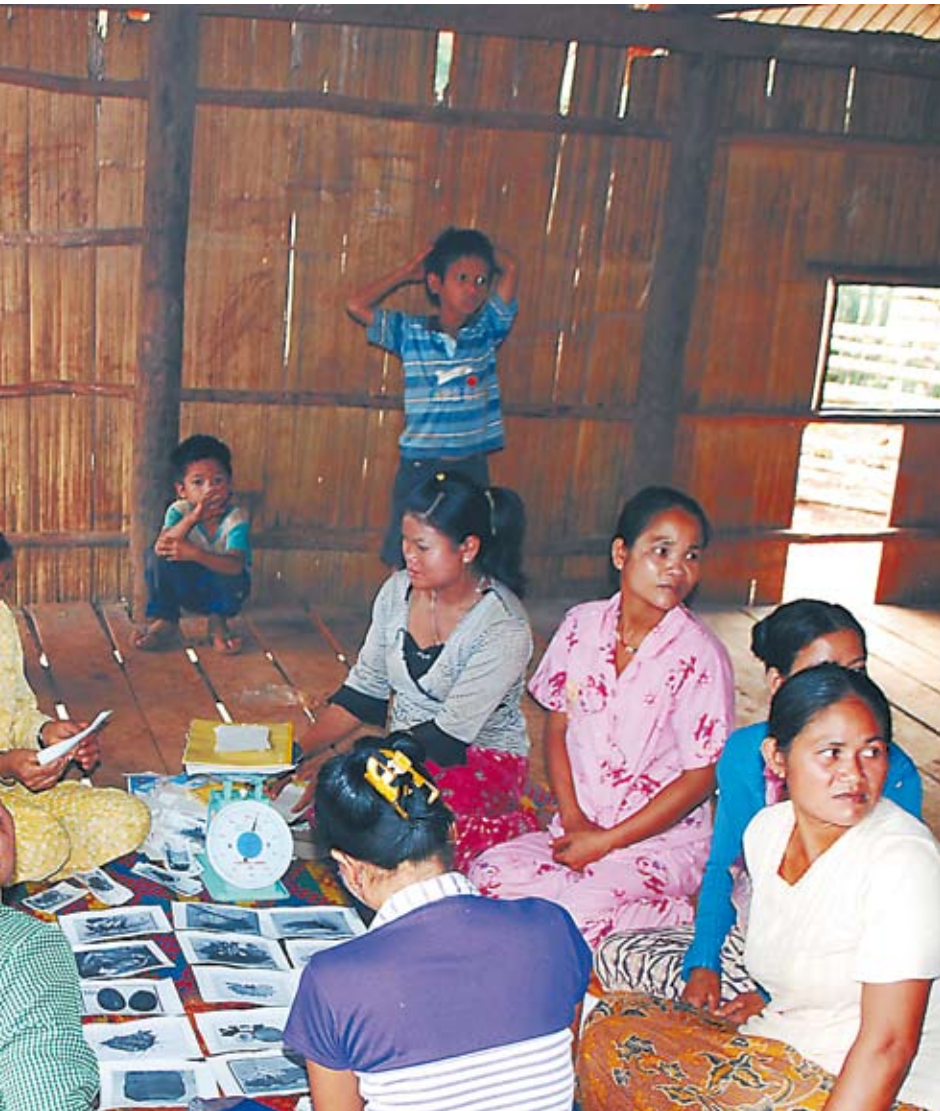
...attavat naisten itseluottamusta.

...ntekijöitä tuli seuraamaan Sovyn ope- ...CC on kristillinen kehitysyhteistyöjär- ...ka koordinoi luku- ja kirjoitustaitotyötä ...zhan vähemmistökansojen parissa. Son- ...n pian töitä ICC:n palveluksessa RIDE- ...ssa. (Ride=Ratanakiri Integrated Deve- ...and Education, Ratanakirin yhdistet- ...s- ja koulutushanke) ICC:n kautta hän ...s koulutusta tehtäviinsä. Nykyään hän ...lee erilaisissa yhteisönkehittämishank- ...hemmistöheimojen parissa sekä auttaa ...omateriaalin tekemisessä.