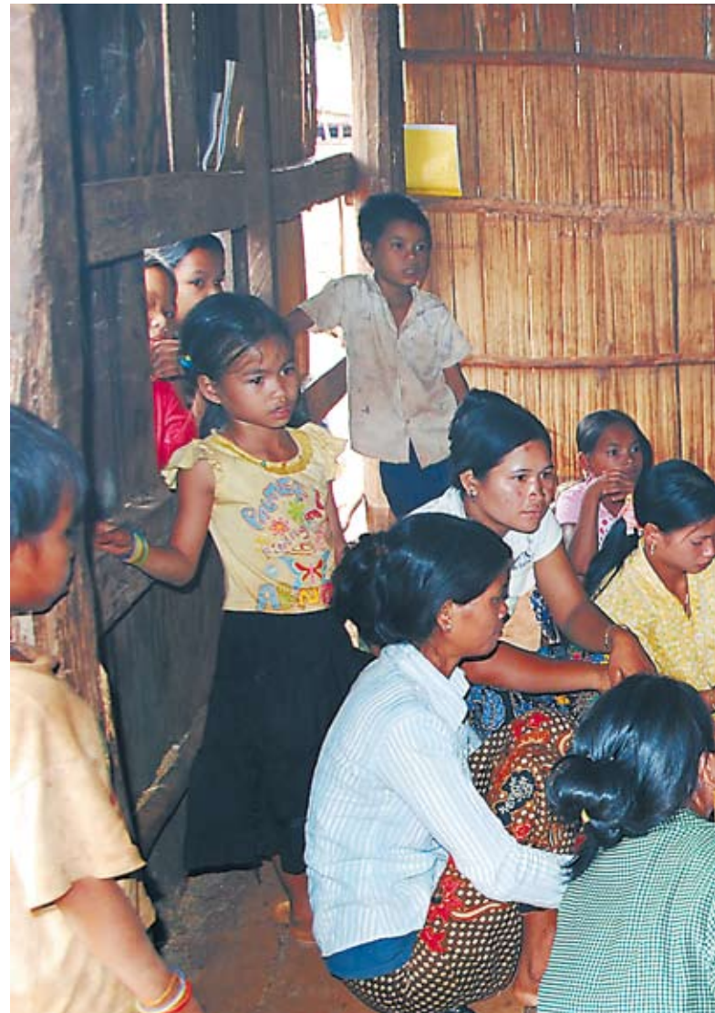
Naisten matematiikkaryhmä Lo ökin kylässä, Ratanakirissä. Lukuja laskutaito kasvatettiin.