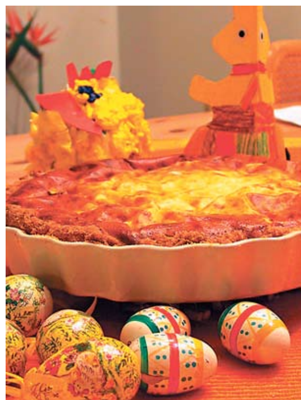
Rahkapiirakka on tullut meille Karjalasta.

Joissakin maissa pääsiäisenä syödään porsasta, koska sitä on vanhastaan pidetty onnea tuot-