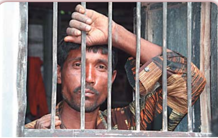
Jos toivoa paremmasta tulevaisuudesta ei ole, tälläkään päivällä ei ole merkitystä.