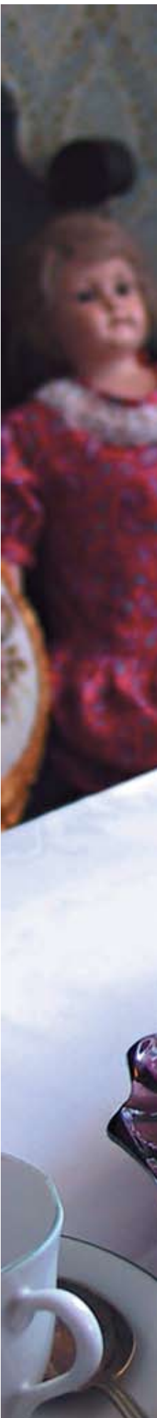
Kulitsa ja pasha ovat ve...