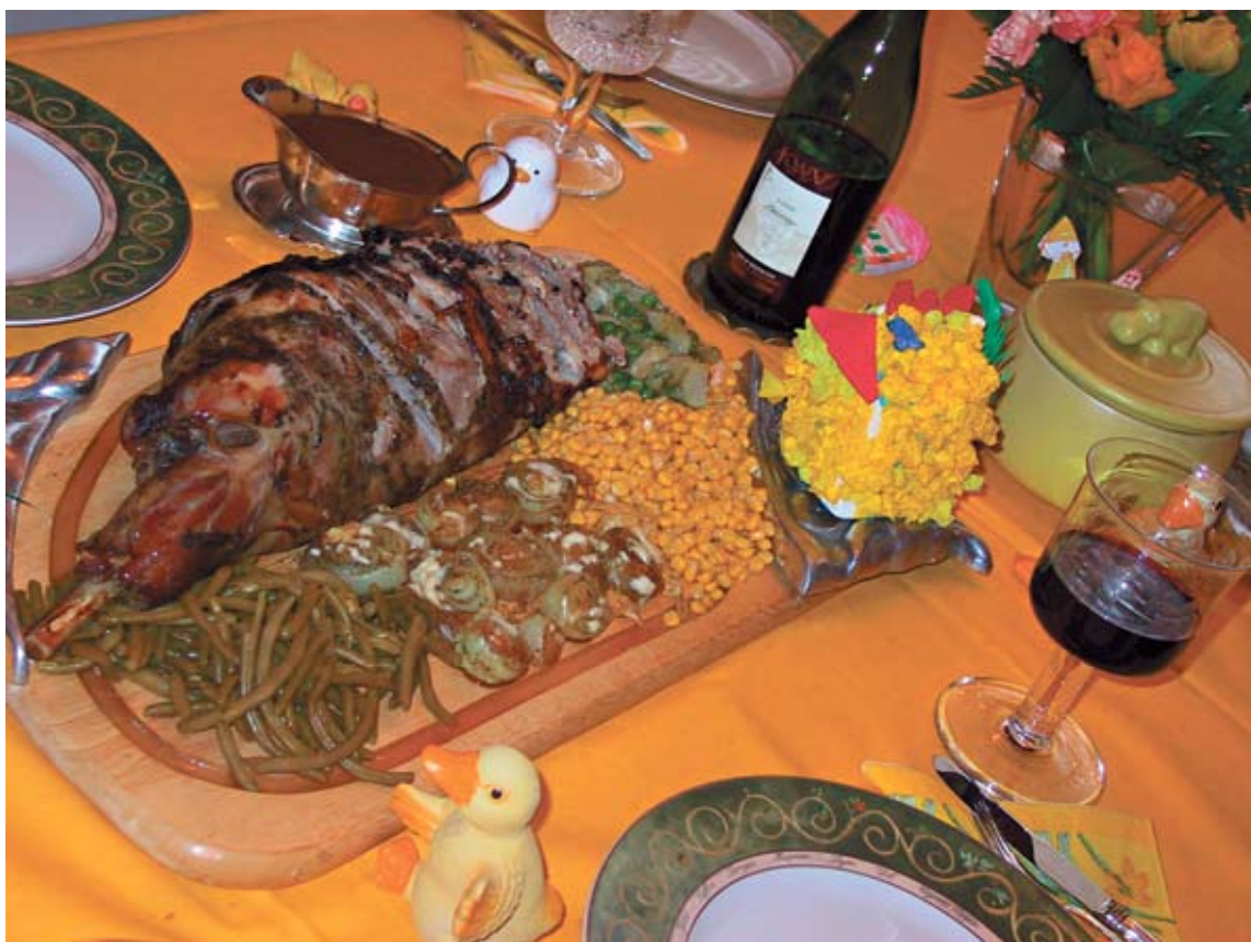
Lammaspaisti on vanhimpia pääsiäisruokia.

Makea kakku, baba, kuuluu slaavilaisten maiden pääsiäispöytään. Perinteisiä leivonnaisia ovat Italiassa makea riisitorttu ja Englannissa pullat, joiden päällä on ristikoristelu Joissakin maissa