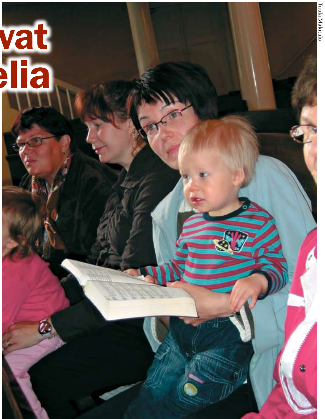
Virsilaulu on kirkollisten juhlien tärkeä elementti. Lapsena opitut virrensäkeet kantavat myös lapsuuden ja nuoruusvuosien muistoja läpi elämän.