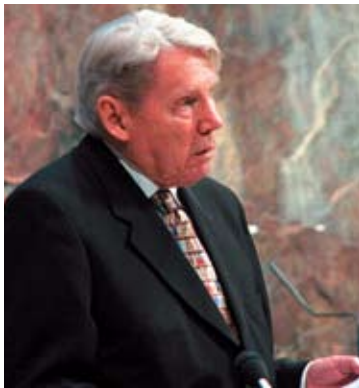
Tauno Väinölä kirja Virsikirjamme virret palkittiin vuoden 2008 kristillisenä kirjana.