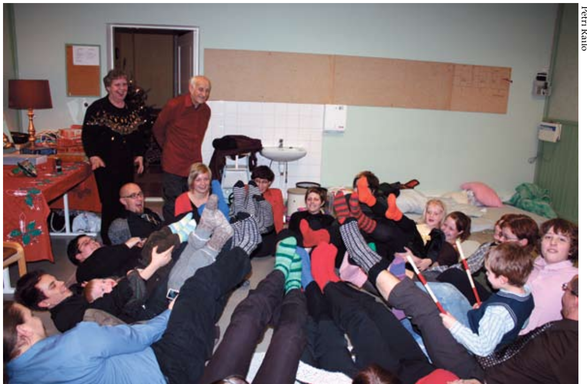
Anja Ja Toimi Suomalaisen perhekunta viihtyy lähetystyön hyväksi valmistetuissa myyjäissukissa.

Ilm. ja tied. puh. (09) 1351 268 Suomen Valkonauhaliiton toimistoaikana tai irja.eskelinen@suomenvalkonauhaliitto.fi