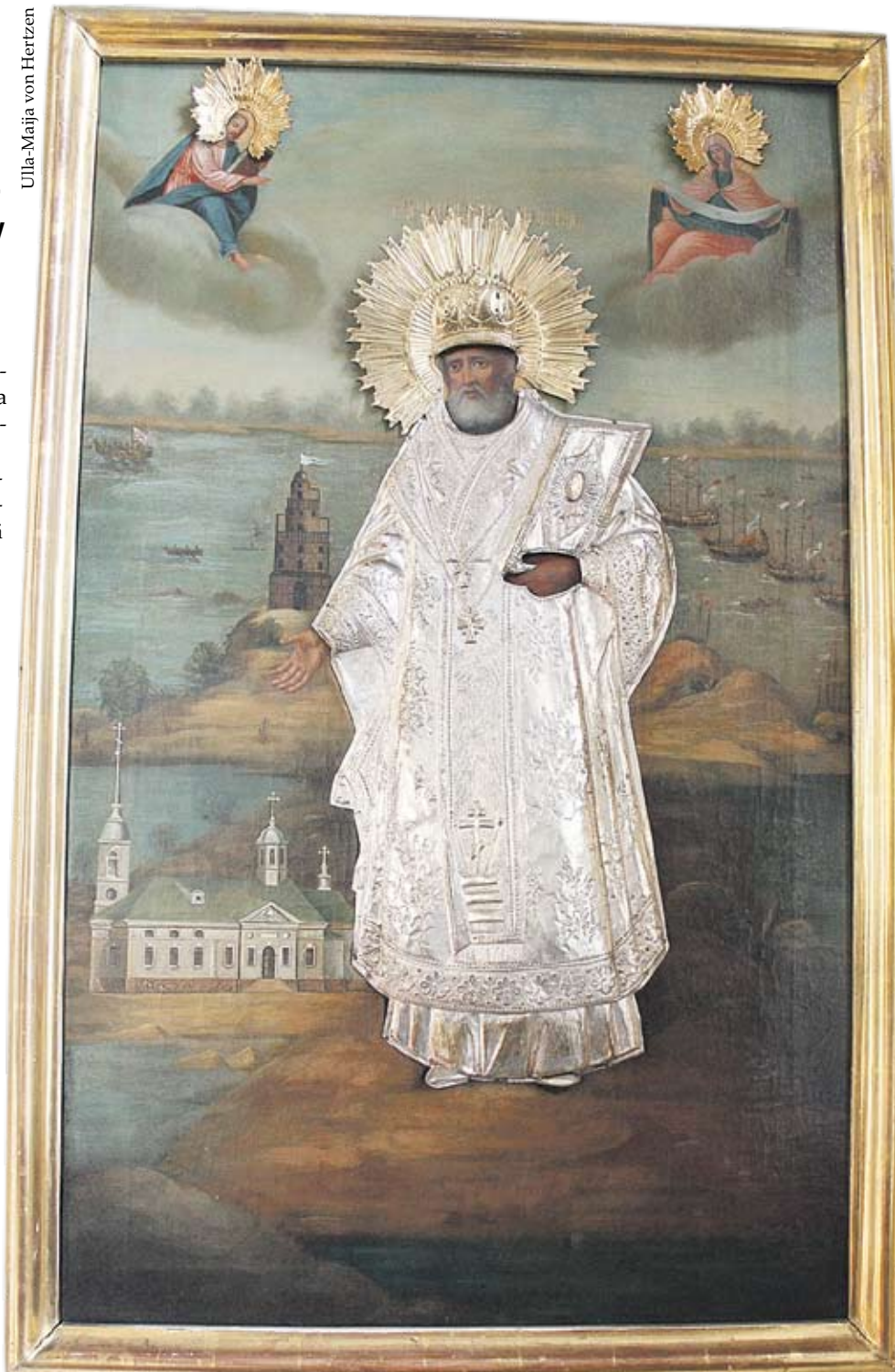
Upea Pyhää Nikolaosta Kotkansaarella esittävä ikoni on maalattu 1700-1800-luvun taitteessa. Kuva Kotkan ortodoksisen seurakunnan Pyhän Nikolaoksen kirkosta.

däntälven tienoille liitti sen helposti vanhoihin pakanallisiin talvijuhliin sekä kristilliseen jouluun. Modernina aikana pyhän Nikolauksen kultti on edelleen kehittynyt, kun häntä on alettu kunnioittamaan joulupukkina. Pyhimykseltä odotettiin ihmetekoja, Joulupukilta odotetaan lahjoja. Legendan mukaan pyhä Nikolaus myös pelasti antamallaan myötäjäislahjoilla kolme köyhää neitokaista avioliittoon.