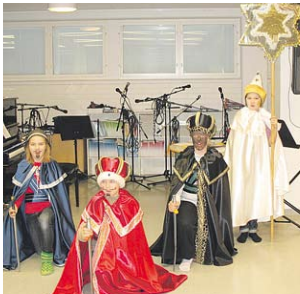
"Enkelit ne paimenille ilmoittivat juur'ett' Juuttaan maalle syntynyt on Vapahtaja suur'."