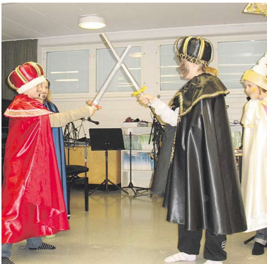
"Hoo, sinä et ole mikään kuningas vaan yksi styränki."

Lähdekirjoja: Rauno Myllylä, Tähti se kulukeepi ja Kaisu Vuolio, Suomalainen joulu