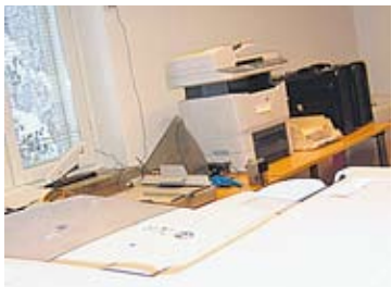
Alakerran kopiokoneet ja toimistotarvikkehuone palvelevat eri työmuotojen tarpeita.

Aulassa mukavat tuolit antavat mahdollisuuden levähtää, jos on tarve tai jonossa muitakin asiointiin halukkaita. Kuka on menossa pappien puheille, kuka jonossa seurakuntatöihin. Joku etsii kanttoria. Kirkkomusikanttien toimisto löytyy yläkerrasta.