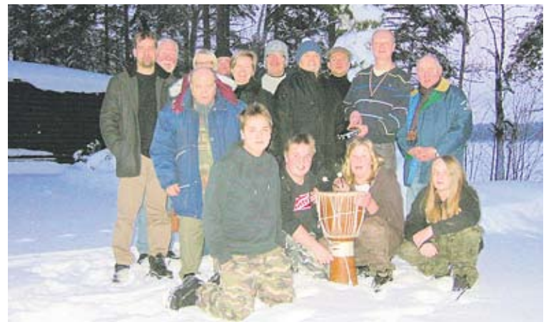
Via Cruciksen harjoitusten välillä räpäistiin kuva lumen ja pakkasen keskellä.