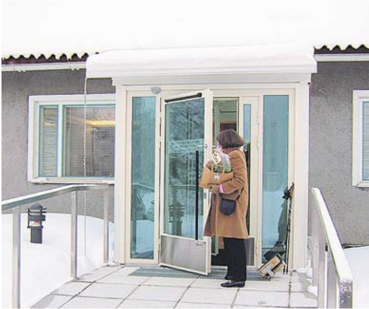
Käytännöllinen sisäänkäynti on ainoa uudistus, joka näkyy ulospäin.