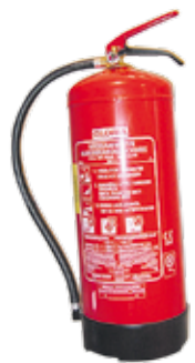
Varautuminen on nykyaikaa.