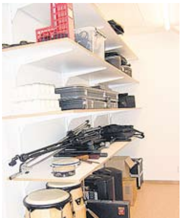
Soittimet ovat saaneet komeat hyllyt kanttorien yhteisen työhuoneen perällä. Laulukirjat ja nuotit ovat kaapeissa. Näyttää siltä, että täältä on hyvä lähteä töihin kirkkoon.