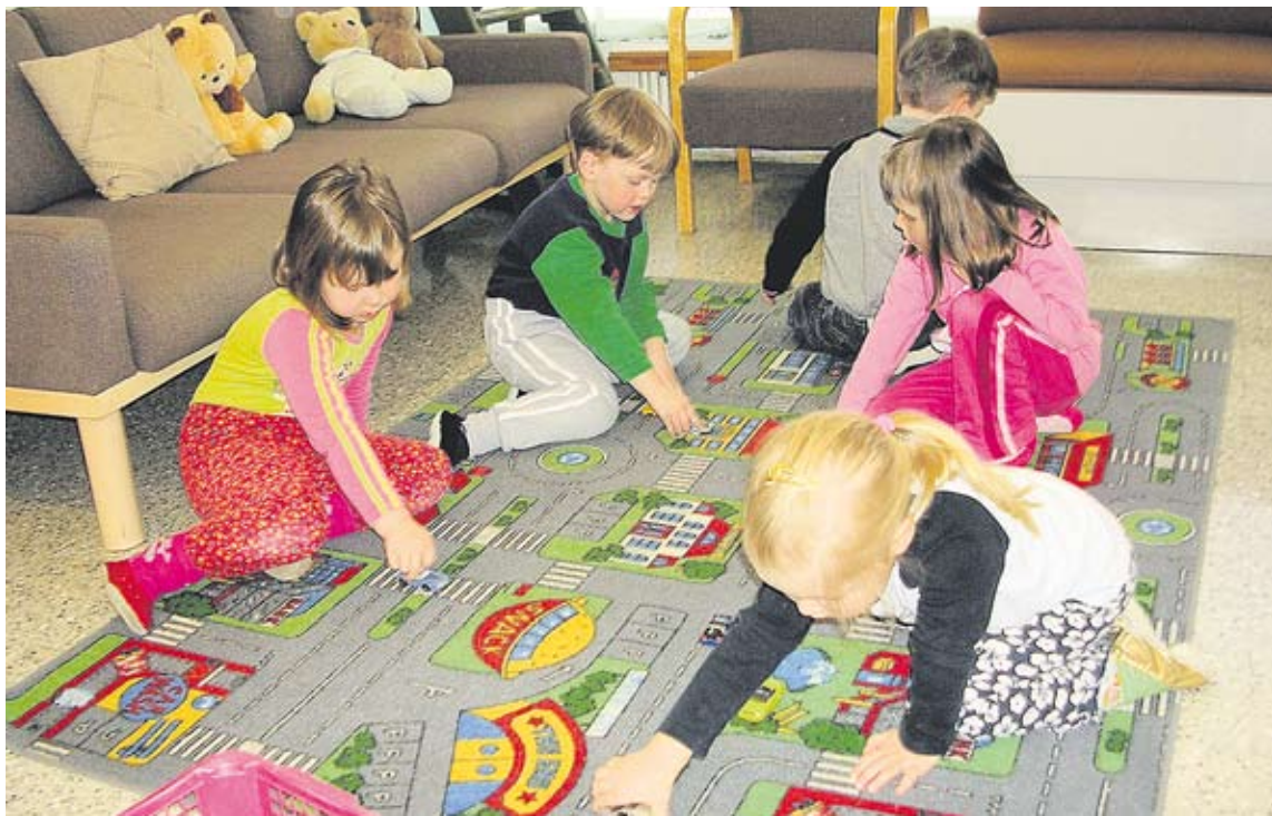
Seurakunnan lapsityö tukee lapsen kristillistä kasvatusta ja kokonaisvaltaista kehitystä.