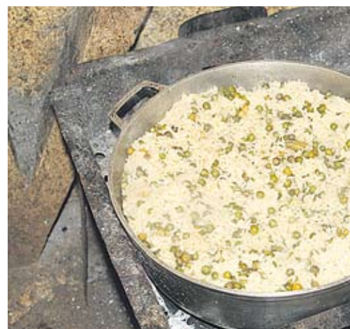
Tätä ruokaa, riisiä ja papuja, syödään päivästä ja vuorokaudesta.

Jokainen omassa maassa kasvatettu jamssi, kassava, kurpitsa tai muu kasvi on perheelle tärkeä. He eivät voi syödä niitä