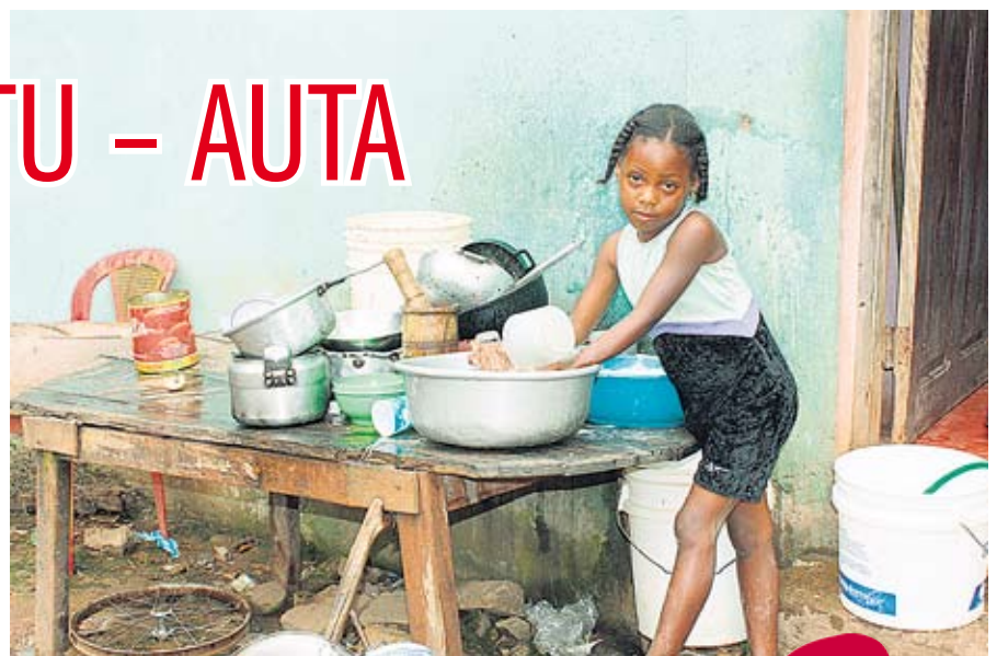
Evalise pesee astioita.

Yhteisvastuukeräystilit ja seurakuntien viitenumerot