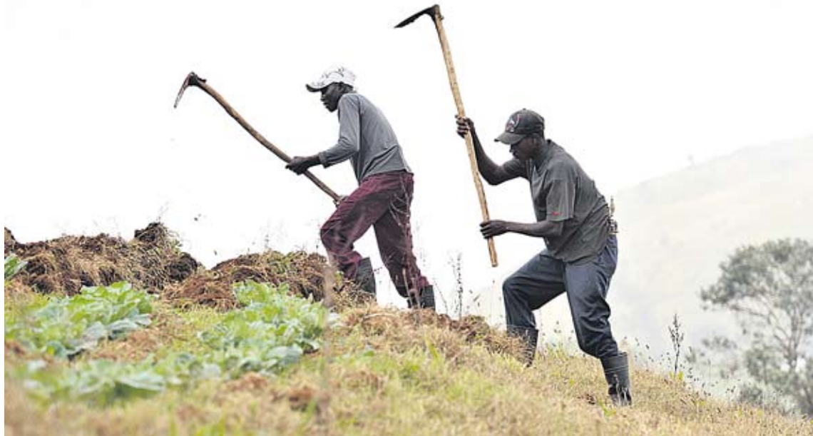
Kivikkoisessa maaperässä pellot on muokattava viljelykuntoon täysin käsityönä.