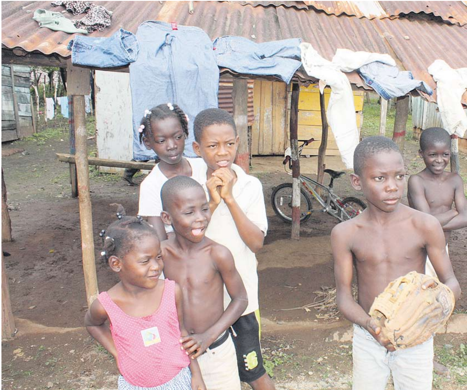
Haitilaiset lapset osaavat kertoa unelmistaan. Lähes jokainen tyttö tahtoo näyttelijäksi ja poika kuuluisaksi baseballtähdeksi.

Haitin bruttokansantuote asukasta kohden on läntisen pallonpuoliskon alhaisin, ja Haiti onkin yksi maailman köyhimmistä maista. Maassa erot rikkaiden ja köyhien ihmisten välillä ovat valtavat.