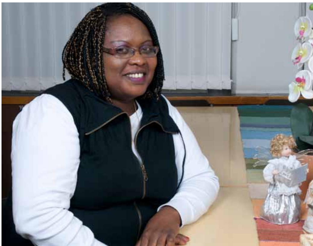
Saturnine Ganumhozan tärkein jouluperinne on ruandalainen tapa rakentaa joulutalo. Sen sisään asetellaan pienet veistokset, Maria, Joosef, Jeesus-lapsi ja enkeleitä.