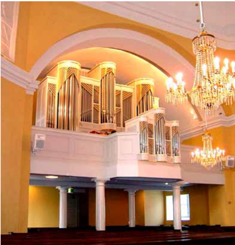
Adventtina 1991 käyttöön vihityt Kymin kirkon 43-äänikertaiset urut on rakentanut tanskalainen urkurakentamo Bruno Christensen & Sonner. Valoisaan kirkkosaliin kauniisti sointuvissa uruissa on piirteitä 1600- ja 1700-lukujen pohjois-saksalaisesta urkujenrakennustaidosta ja 1800-luvun ranskalaisesta romantiikasta.