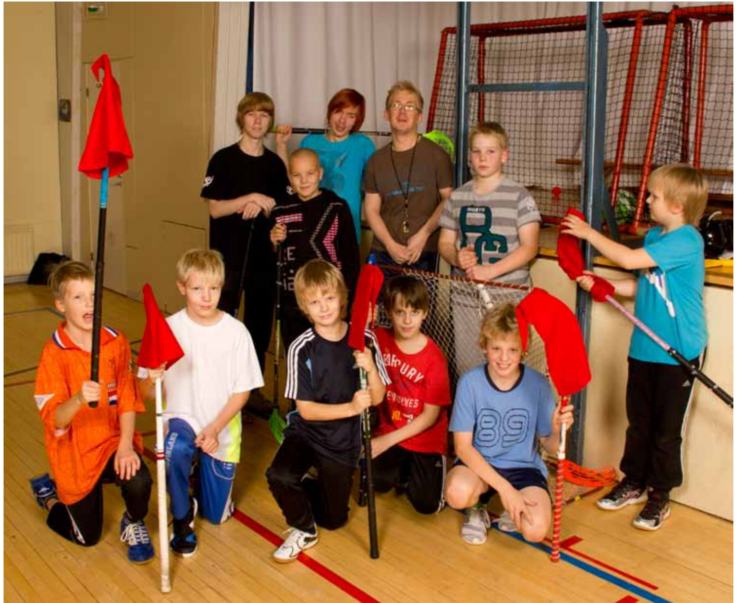
Korkeakosken poikakerho asettui kuvaan leikkimielellä, mailojen päähän puettujen tonttulakkien verran pikkujoulutunnelmissa. Kerholaiset ohjaajineen toivottavat hyvää joulun odotusta kaikille!