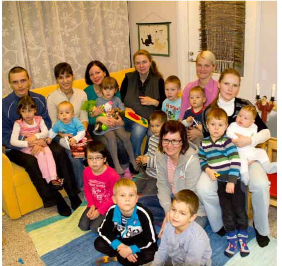
Seurakuntayhtymän kerho venäjää puhuville perheille kokoontuu maanantaisin Ristinkalliolla. Suomalainen joulu on useimmille vielä melko uusi kokemus. Kerholaisista osa kuuluu luterilaiseen kirkkoon, osa on ortodokseja.