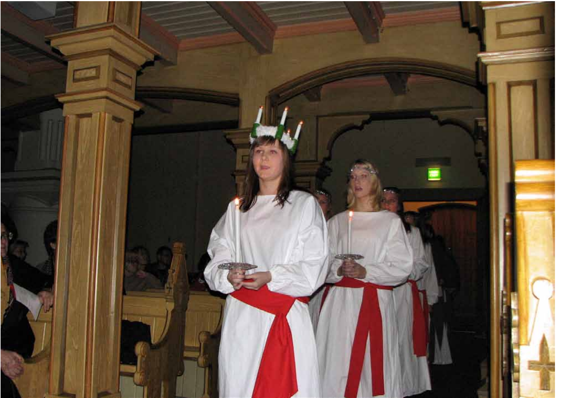
Kotkan kirkon Lucia-kulkueessa vaeltaa kohti alttaria Kotkan-Seudun musiikkiopiston Nuorisokuoro Merituulen laulajia.