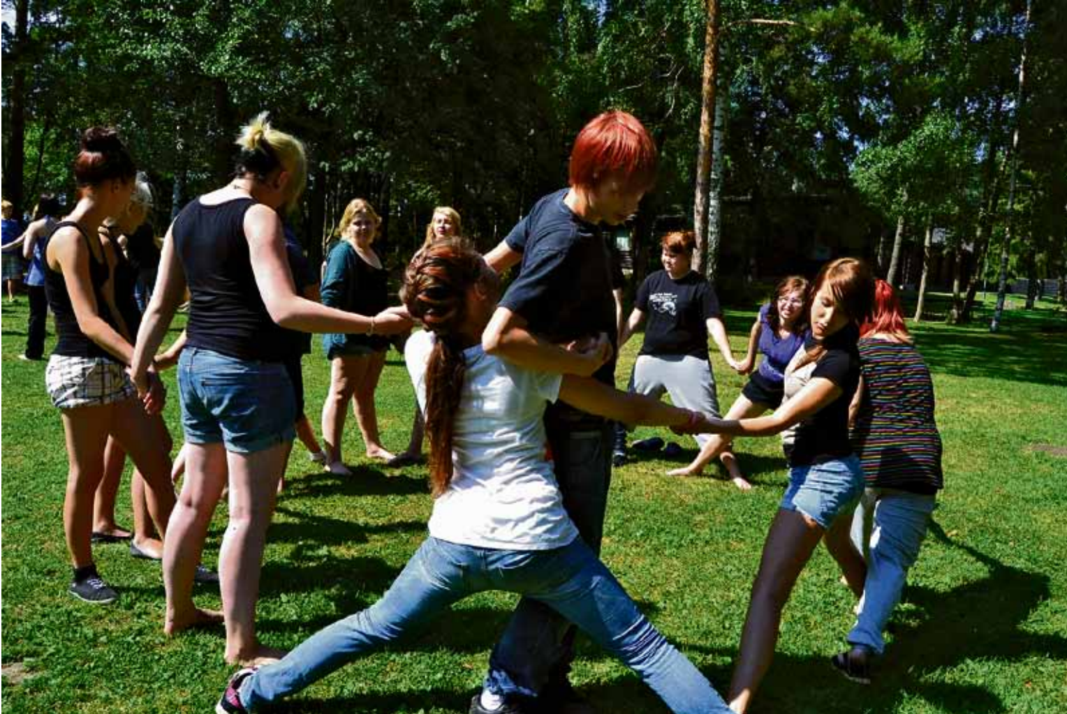
Rippikoululeiriläisiä Höyterissä kesällä 2011.

www.kotkanseurakunnat.fi > Langinkosken seurakunta / Toiminta / Rippikoulu / Ilmoittautumislomake