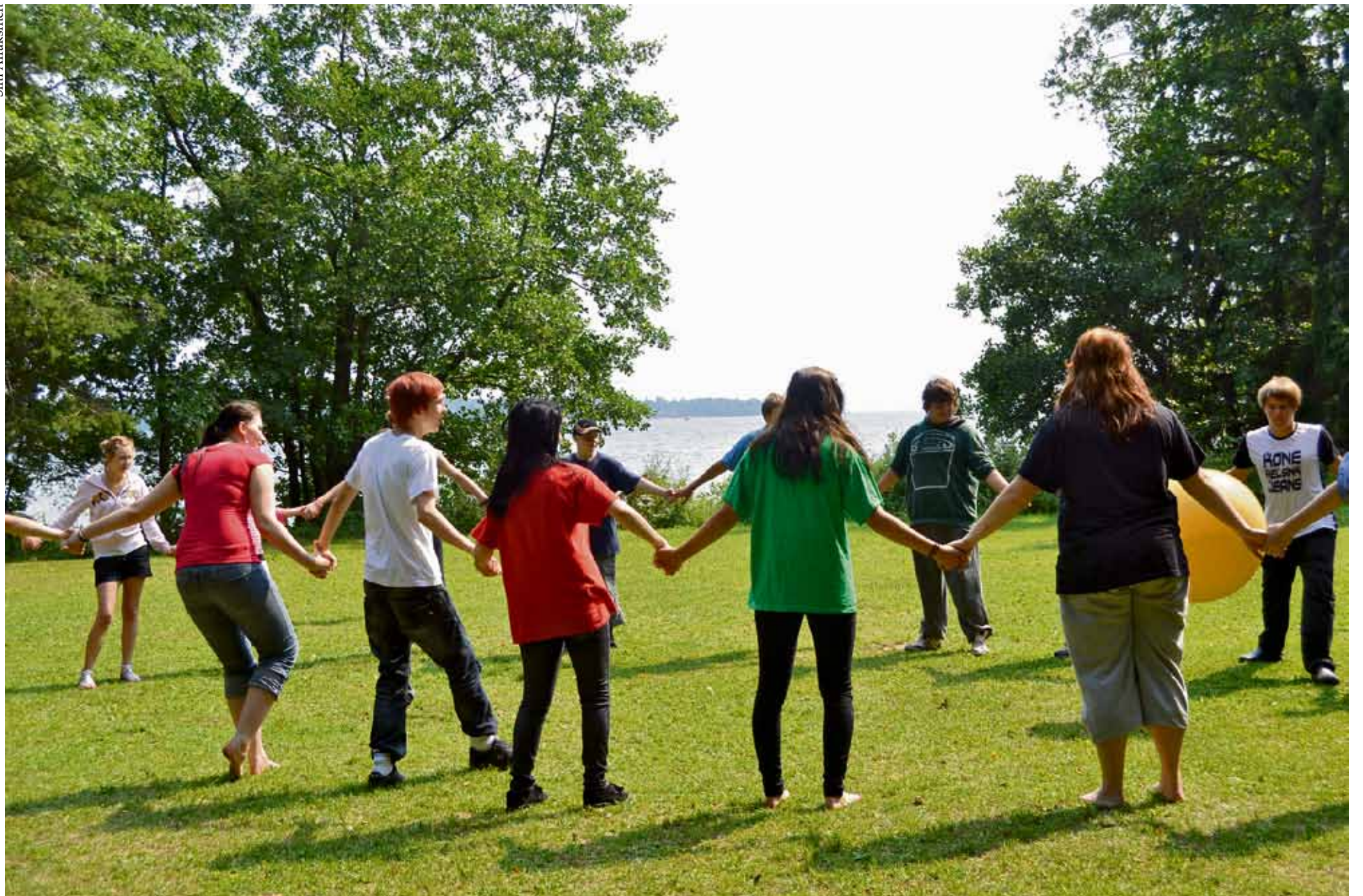
Riparilaiset kisaavat Höyterin ranta-aukiolla.

Lehtinen 1: Tutustumisleiri 10.-11.2. ja kesän leirijakso 8.-14.6. Konfirmaatio 17.6. Kotkan kirkossa.