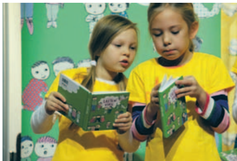
Monelle lapselle Lasten virsi on ensimmäinen oma laulukirja. Laula ilosta laulun ilosta!

Uudessa kirjassa on 170 laulua arkeen ja juhlaan. Puolet lauluista on entisiä, puolet uusia. Uusista ennen julkaisemattomia lauluja on 41.