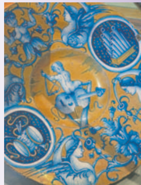
Yksityiskohta Eremitaasin kokoelmista

Raamatun kertomukset itsessään ovat inspiroineet vuosisatojen aikana lukemattomia säveltäjiä. Alkamassa on joulumusiikin sesonki. Jouluyö, juhlayö -laulun ohella yksi rakastetuimpia Raamatun innoittamia teoksia on Johan Sebastian Bachin jouluratorio. Kuusiosainen sävellys pyrkii kattamaan joulunajan suurimmat juhlahypät ja evankeliumin joulukertomukset. Oratoriota valmistellessaan Bach kierrätti teokseen jo aiemmin käyttämiään sävellyksiä. Teos on alun perin sävelletty esitettäväksi joulun aikaan 1734–1735. Kolme ensimmäistä osaa esitettiin perättäisinä joulupäivinä, 25., 26., ja 27.12.