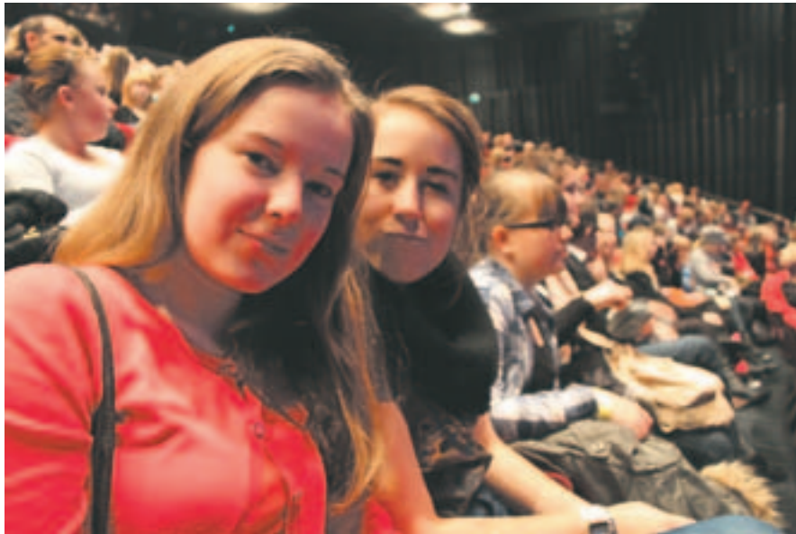
Tytöt odottelevat keikan alkua kaupunginteatterin katsomossa.

tomiksi suosikeiksi nousivat Subway-ravintola sekä McDonalds. Nuoret keräsivät neljä tärkeintä asiaa, miksi juuri McDonaldsissa tuli vietettyä myös runsaasti