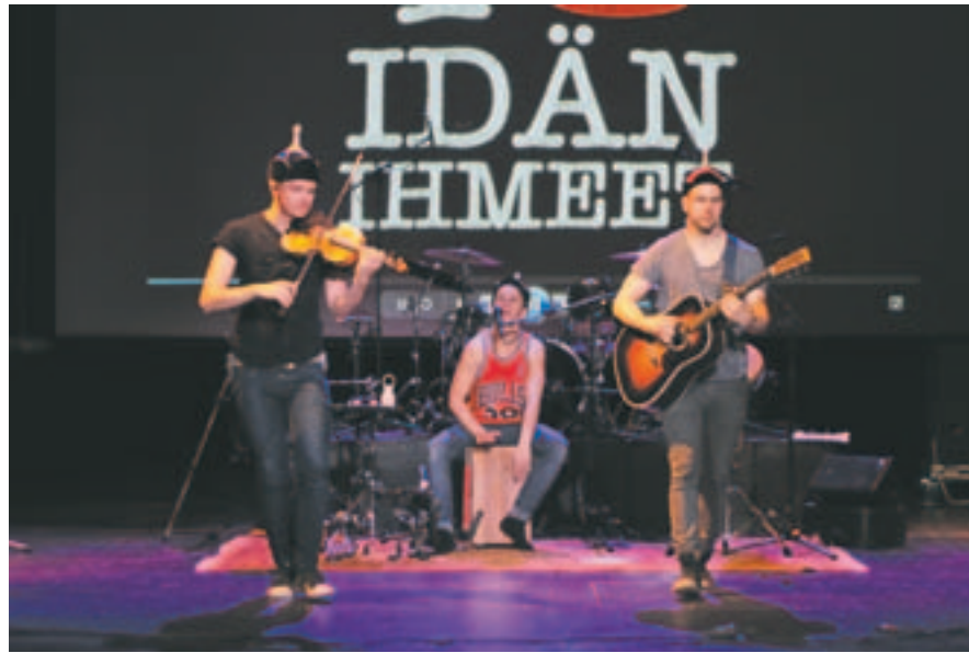
Oulu Gospelin parhaimpiin esiintyjiin kuului energinen Idän ihmeet.

Lauantaipäivään kuului muun muassa kaksi Oulun kaupunginteatterilla järjestettyä konserttia ja mahdollisuus lähteä konserttien välissä Oulun Edeniin, kylpylään loiskimaan. Aikaa jäi myös kaupungilla pyörimiseen ja ravinnon etsimiseen keskustan ravintolatarjonnasta. Ehdot-