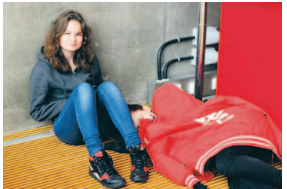
Päiväunet Oulun kaupunginteatterin pehmeällä koolattiamatolla.