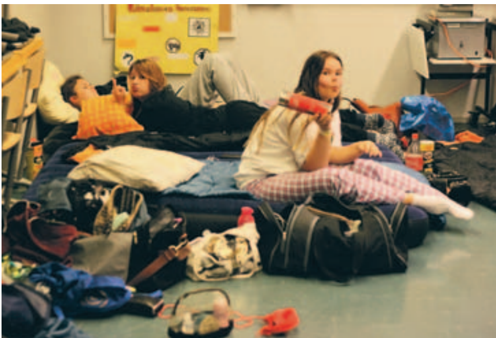
Koulun lattia tarjosi matkaajille oivan paikan leiriyttyä.