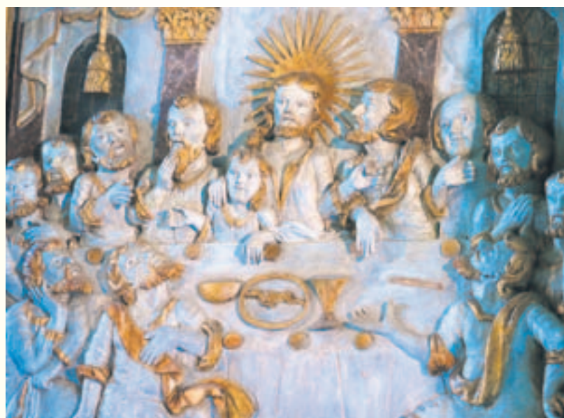
Kirjoittajan kuvaan tallentama teos "Ehtoollinen" on Sakt Olofin kirkossa Simrishamnissa.

Psalmi 22 antaa äänen ihmisen ahdistukselle. Psalmirukous kuvaa voimakkein ilmauksin ahdistuneen psykofyysisiä oireita - niin ruumis kuin mieli kärsivät vastoinkäymisten keskellä. Ahdistuksessaan rukoilija muistaa: "Herra, sinä minut päästit äitini kohdusta". Jumala on rukoilijalle kuin kättilö, joka on ollut läsnä elämän ensi