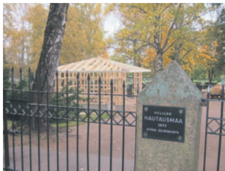
Vuonna 2008 oli rakenteilla mm. tämä jätteen lajittelukatos Helilän hautausmaalle.

Teksti Nanni Mamia, ympäristöohjelman projektityöntekijä