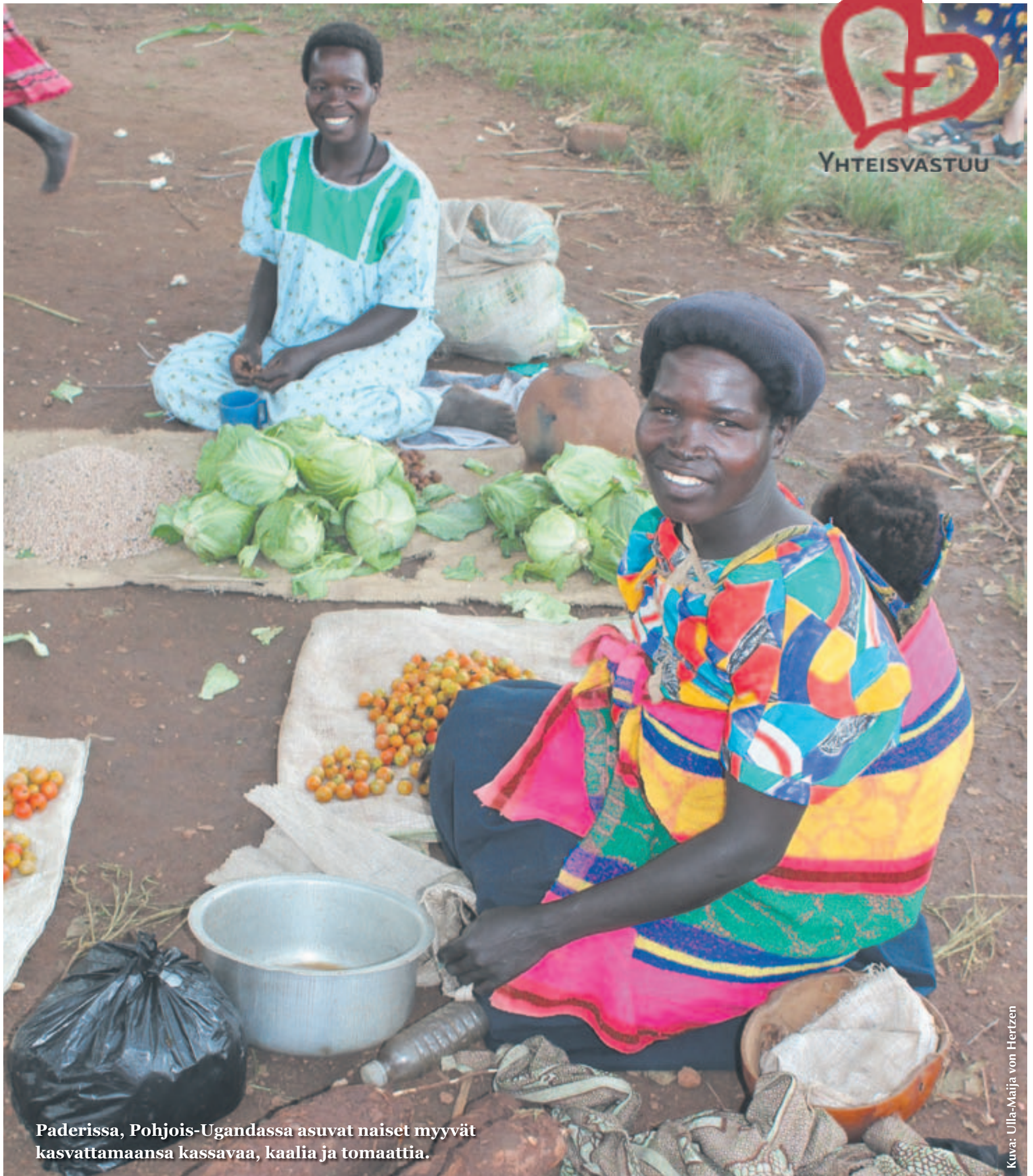
Paderissa, Pohjois-Ugandassa asuvat naiset myyvät kasvattamaansa kassavaa, kaalia ja tomaattia.