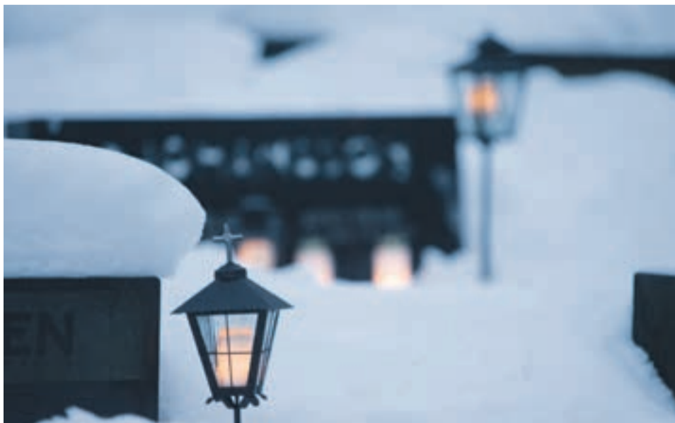
Kynttilät luovat hautausmaille joulun tunnelman.

Kustaa Viikuna: Vuotuinen ajantieto, 1950.