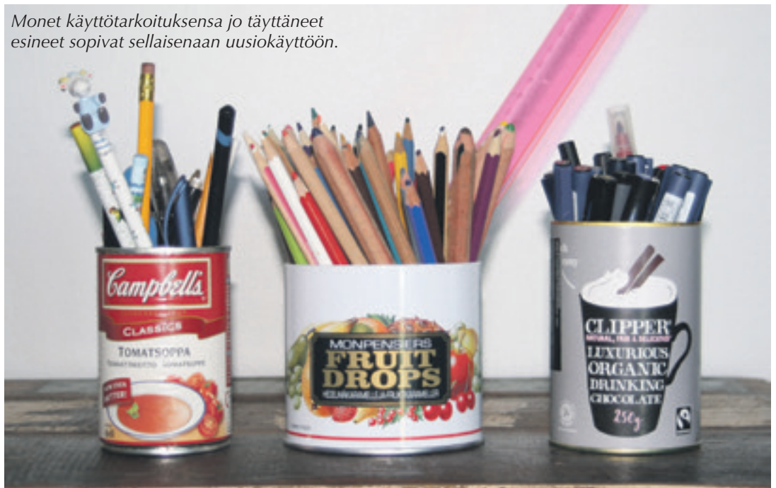
Monet käyttötarkoituksensa jo täyttäneet esineet sopivat sellaisenaan uusiokäyttöön.