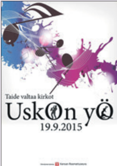
Uskon yö tarjoaa paljon korkeatasoisia kulttuuritapahtumia.