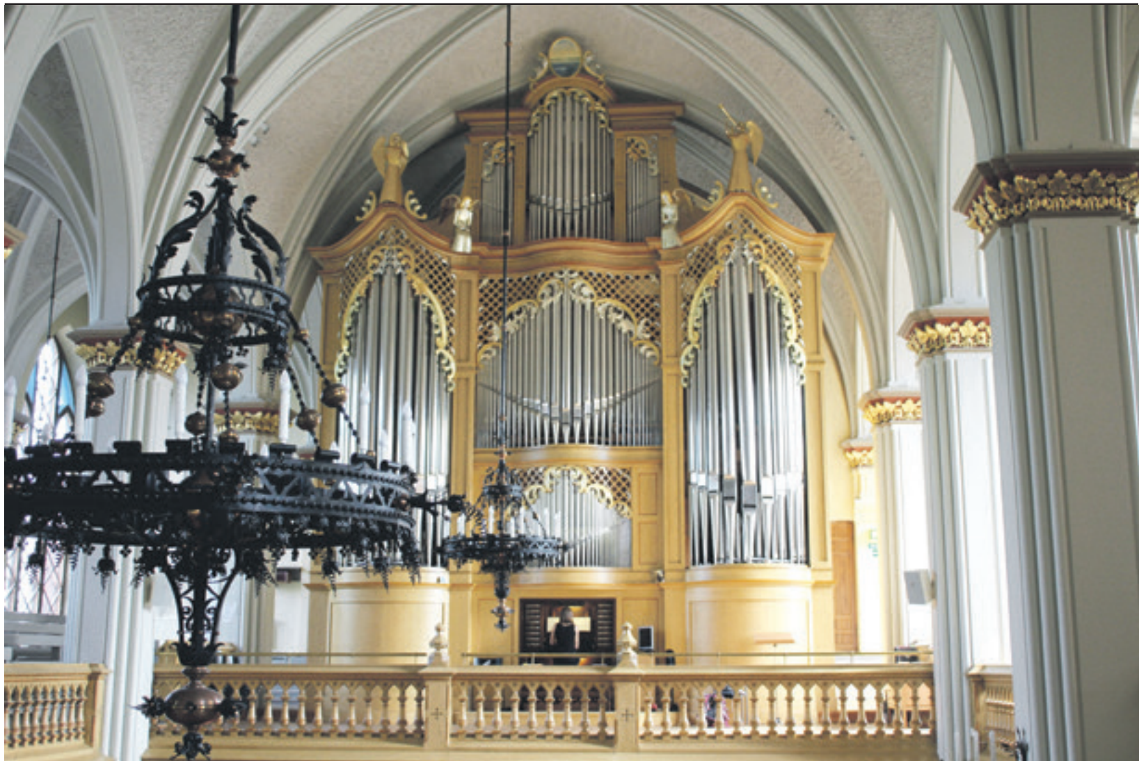
Kotkan kirkon urut soivat taiturien käsissä Urkuviikolla.