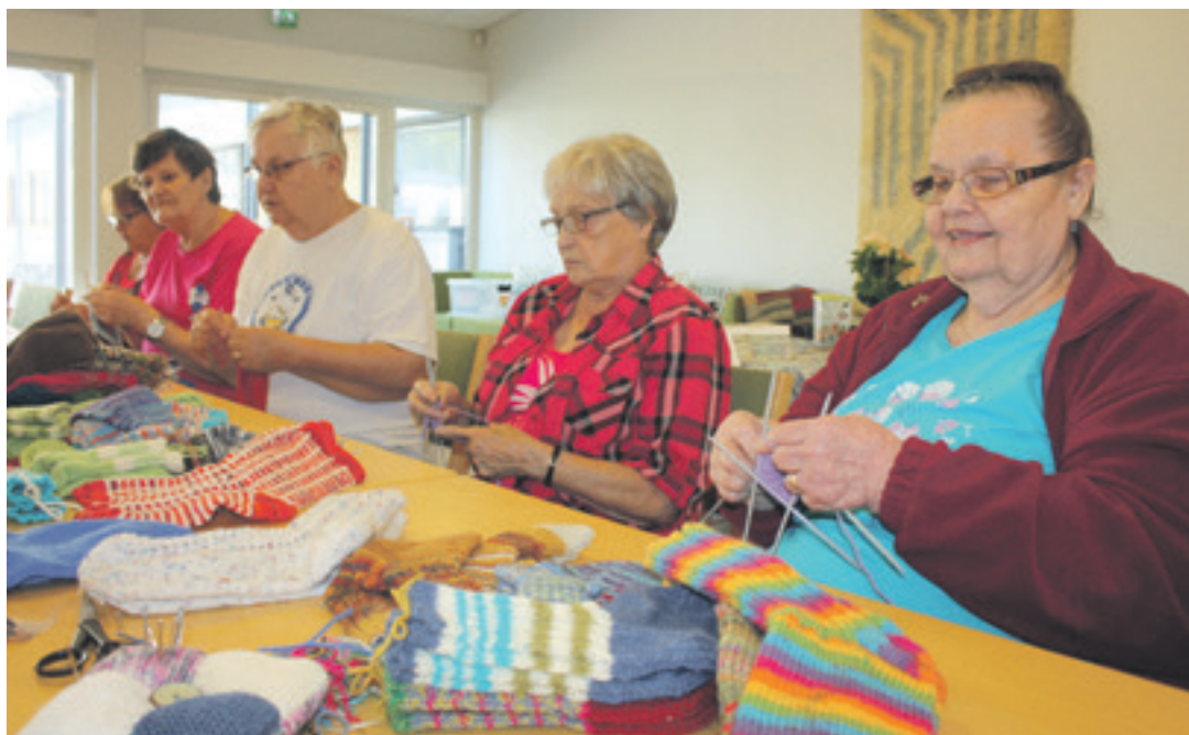
Aurinkoisena torstaina oli Karhulan seurakuntakeskukseen kokoontunut taas parikymmentä neulojaa.