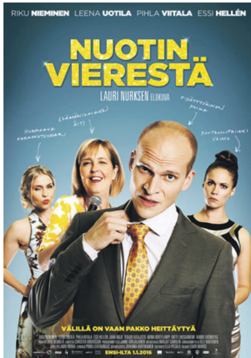
Nuotin vierestä -elokuva on osittain kuvattu Kotkassa.