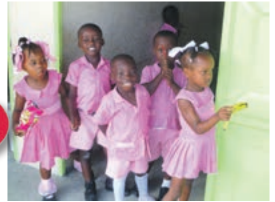
Koulupuvut ovat kauniita, ja niihin pukeutuneina lapset ovat tasa-arvoisia.