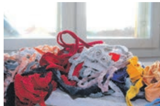
Kuteista kaikki alkaa.

Rasinmäki on kehittänyt ja patentoinut uuden tekstiilimateriaalin, joka sopii mattojen lisäksi akustisiin tekstiileihin. Niillä vähennetään tiloista kaikua. Nyt on vuorossa tuotannon suunnittelu.