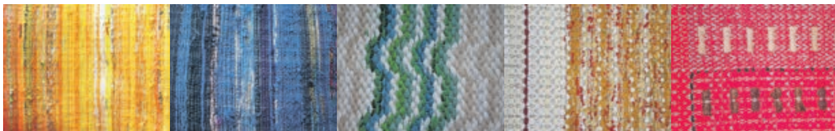
Mattojen värit tuovat iloa ja lämpöä jokaiseen päivään.

Myöhemmin, nuorena turhautuneena koti-äitinä Eija mietti, mitä elämässään tekisi. – Äiti sanoi, että mitäpä jos rupeat kutomaan mattoja. Hän osti minulle käytetty kangaspuut, ja siitä se alkoi.