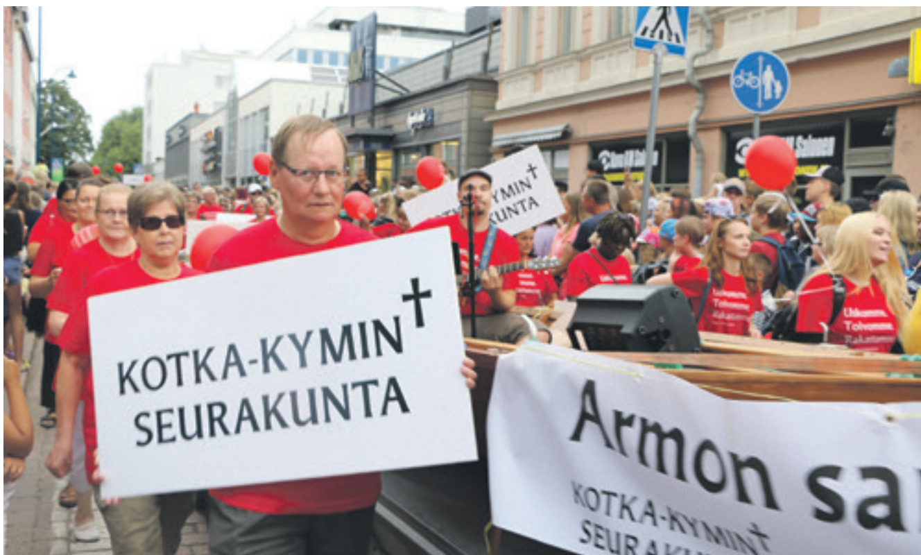
Uusi seurakunta oli näkyvästi esillä Meripäivien paraatissa.