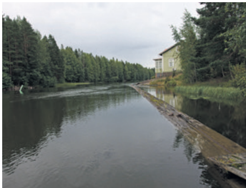
Saukkolanvirta ei näytä vaaralliselta. Kun katsoo tarkemmin, veden meno huimaa. Virrat yhdistävät ihmisiä niin fyysisessä kuin ajatusten maailmoissa.

Virrat pelottavat. Ne vievät, jos ei ole tukea tai mahdollisuutta pelastautua. Vedessä on sellaista voimaa, että se on tarjonnut hurjia vertauskuvia. Tulvat, hyökyaallot, pyörteet ja virtaukset täyttävät sanastomme. Pakolaisvirralla tai -tulvalla isketään pelkoa Euroopan ihmisiin. Vihamieliset sanavirrat täyttävät internetin ja kadut.