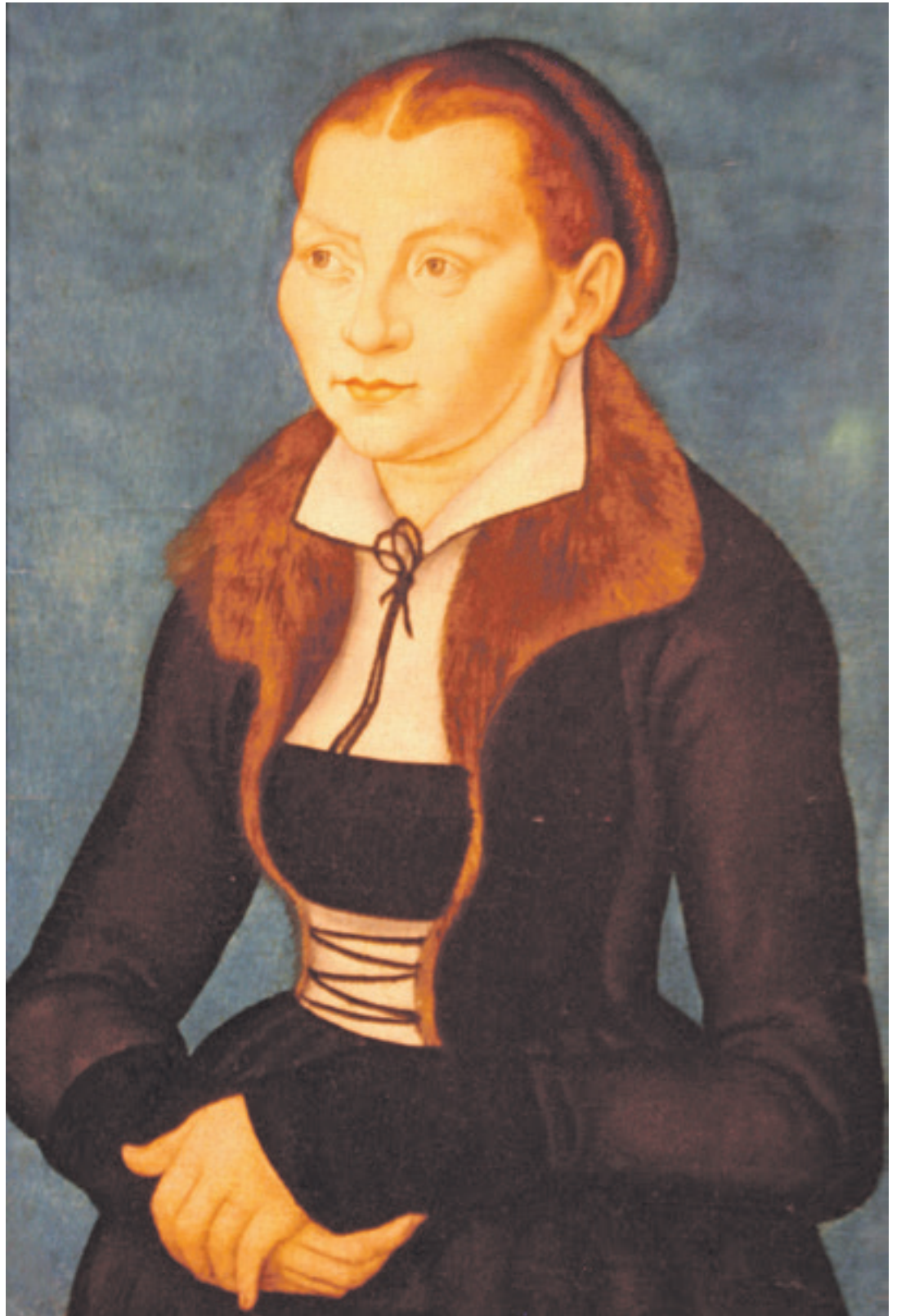
Katharinaa ei ole sanottu kauniiksi. Lucas Cranach vanhemman maalauksessa (1526) näkyy vahvatahtoinen nainen.

Kirjeissä vaimoa kuvataan eri hellittelynimillä. Luther kirjoitti usein, että rakastaa vaimoaan. Sanat eivät ole korulauseita, sillä kirjeissä hän kyselee jatkuvasti arkisista asioista. Valitettavasti vastauskirjeitä ei ole säilynyt.