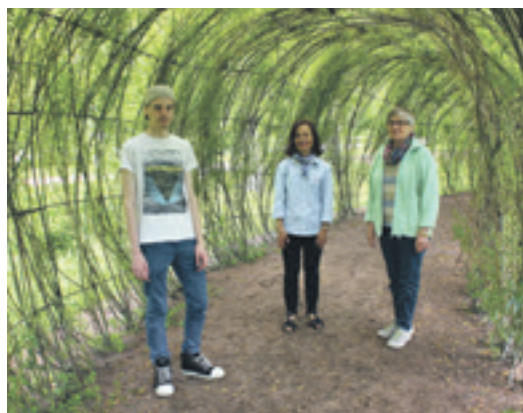
Kotka-Kymin seurakunnassa toimii paljon vapaaehtoisia. He tietävät, että auttaja saa toiminnastaan paljon elämänsisältöä.

Naisten Pankki Kotka etsii joukkoonsa häntä, joka hallitsee sosiaalisen median ja voi ottaa hoitaakseseen esimerkiksi tilaisuuksien mainonnan somessa.