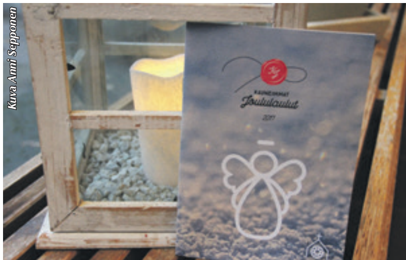
Pian lauletaan joululauluja Kotka-Kymin seurakunnassa. Tervetuloa yhdessä laulamaan sydämeemme joulun ihme!

Viime vuosien suosituinta joululaulua En etsi valtaa, loistoa lauletaan kohta joululaulutilaisuuksissa. Zacharias Topeliuksen ja Jean Sibeliuksen laulu on saanut pysyvän paikan suomalaisten sydämissä. Laulutilaisuudet osoittavat, että suomalaiset ovat laulukansaa joulun alla.