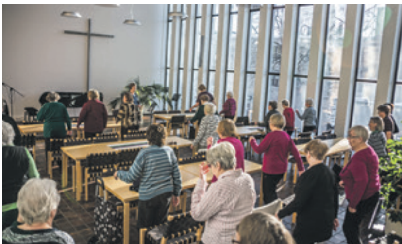
Karhulan seurakuntakeskuksen saliin kokoonnutaan tiistaina, tarjolla on asiaa, jumppaa ja kahvit.

Kolmas aktiivipäivä. Mummi kävi Päiväkuorossa . Äitiä koetin rohkaista Lauluämpäriin .