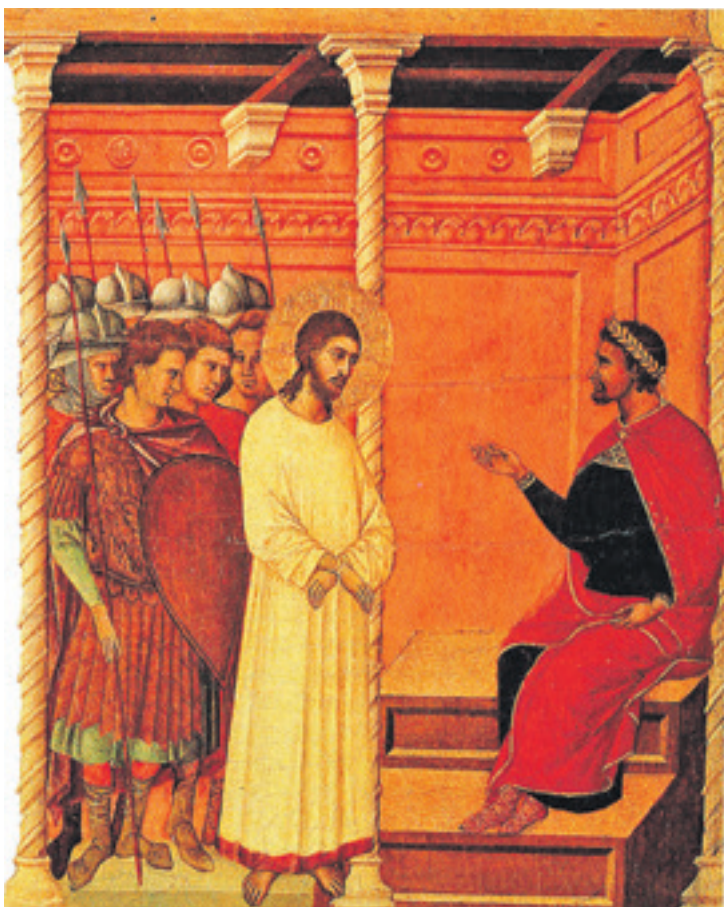
Sienan tuomiokirkon alttaritaulussa Italiassa kuvataan Jeesusta Pilauksen edessä. Maalaus on Duccio di Buoninsegnan vuosina 1308-1311 maalaama.