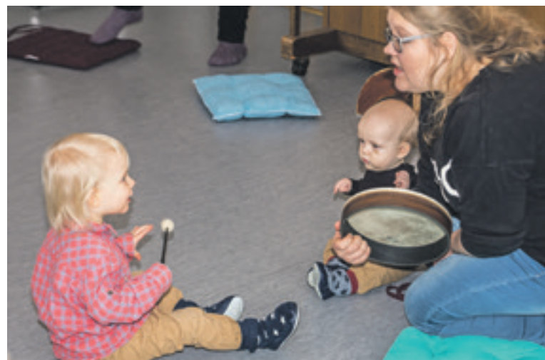
Lasten kirkkomuskareissa pidetään arkipyhäkoulu ja lauletaan. Siellä pääsee tutustumaan myös rytmisoittimiin.