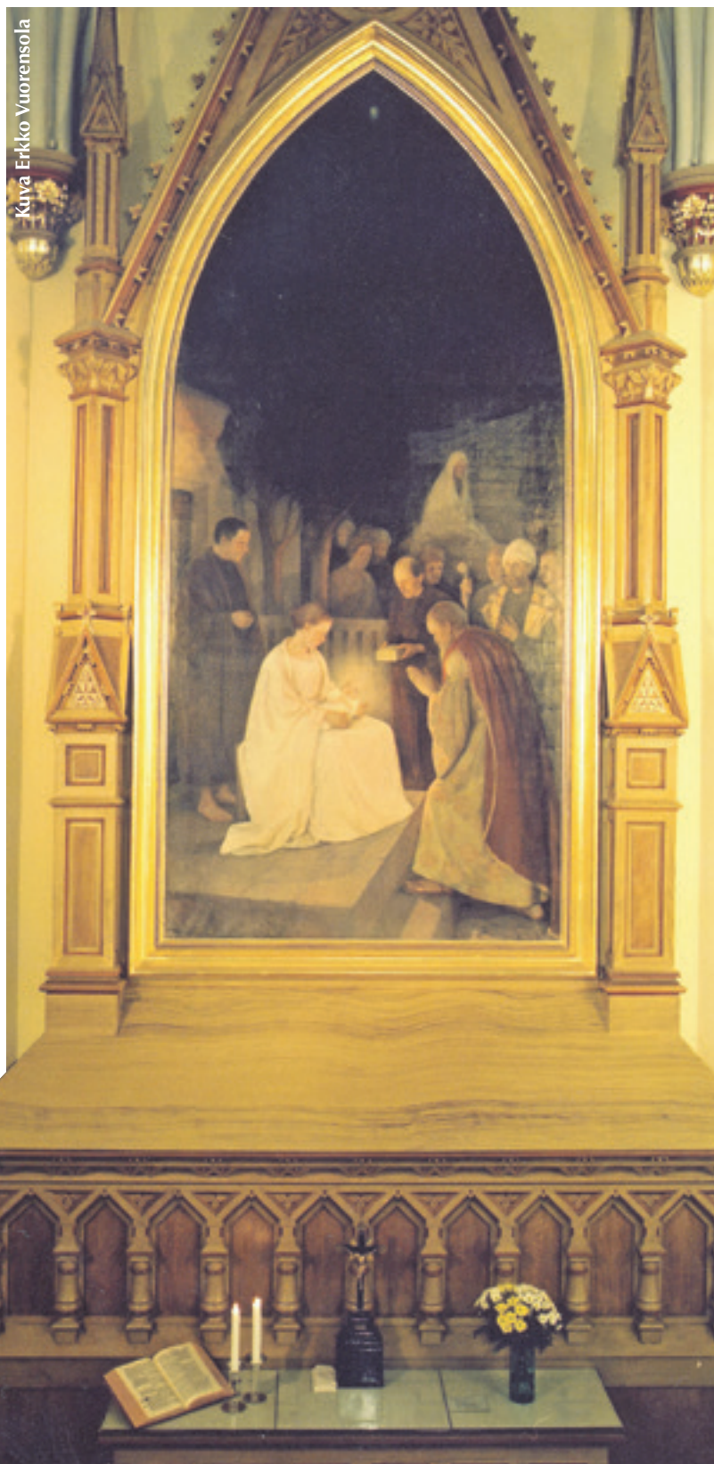
Pitkäperjantain liturginen väri on musta. Se on kuolemansurun väri.

Katolisessa kirkossa puhutaan Marian seitsemästä surusta. Moni voi samaistua Marian hätään, kun Jeesus katoaa 12-vuotiaana. Suurim-