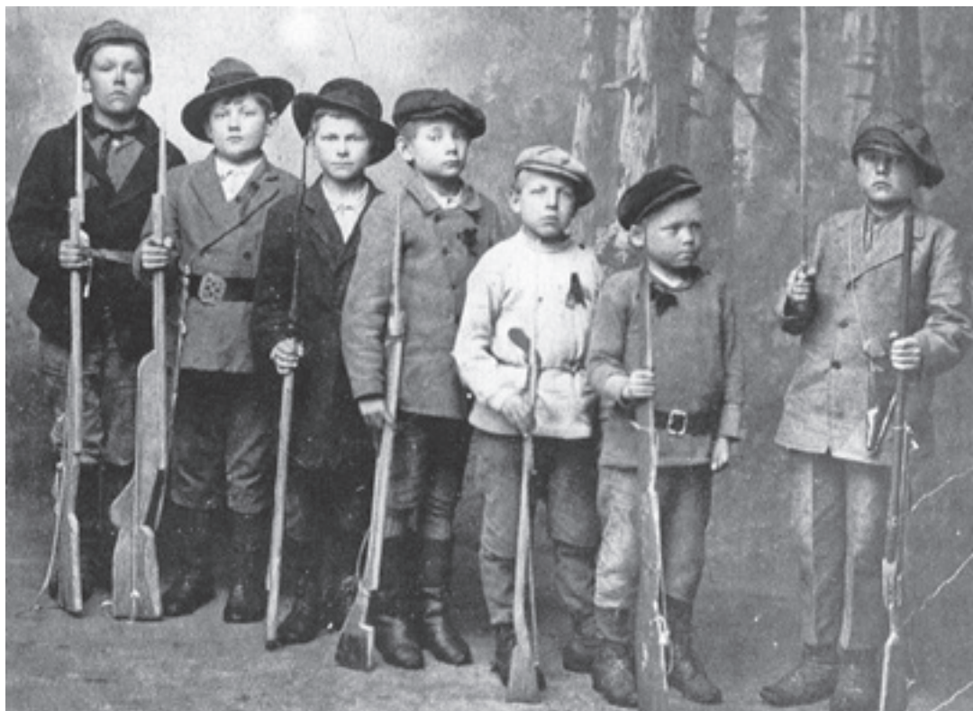
Sisällissota ahmaisi miehet, naiset ja lapset. Kuvassa pieniä punakaartilaisia Kymissä vuoden 1918 alussa.

Ruumissaattueet ilmestyivät sodan aikana Kotkankin katukuvaan.