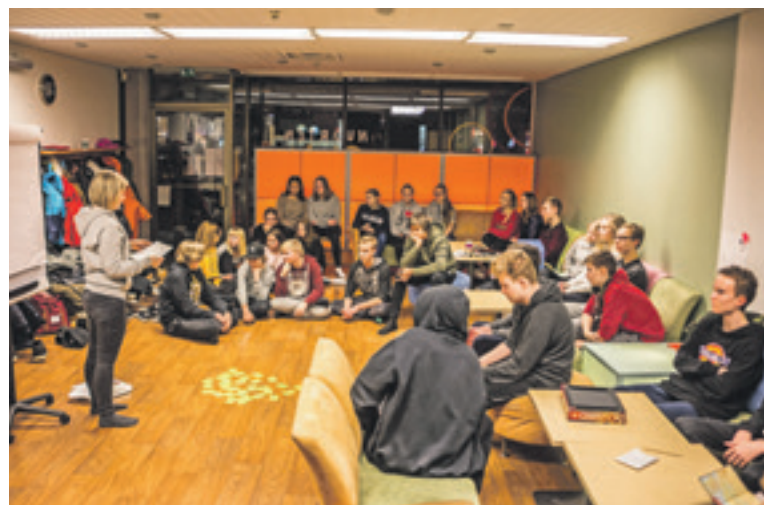
Nuorille on useita kokoontumistiloja. Tässä vietetään iltaa Arkussa, joka sijaitsee Kotkansaarella.

Toivolla oli palloilukerho Aittiksessa . Muut suuntasivat Langinkoskelle Meijän keittiöön , jossa aikuinen maksaa ruoasta 3 euroa ja lapsille se on ilmaista. Lohikeitto maistui Tildallekin.