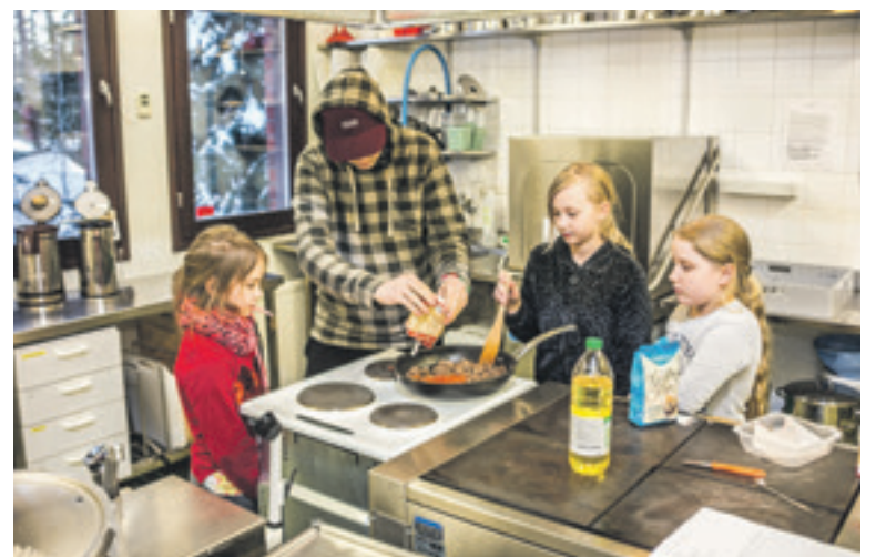
Kouluikäisten kokkikerhot ovat suosittuja ja niitä pidetään eri puolilla Kotkaa. Kuvassa kokataan Aittakorvessa.