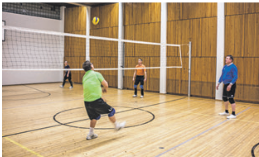
Naisten ja miesten lentopalloa pelataan tiistaisin Kotkan seurakuntakeskuksen voimistelusalissa.