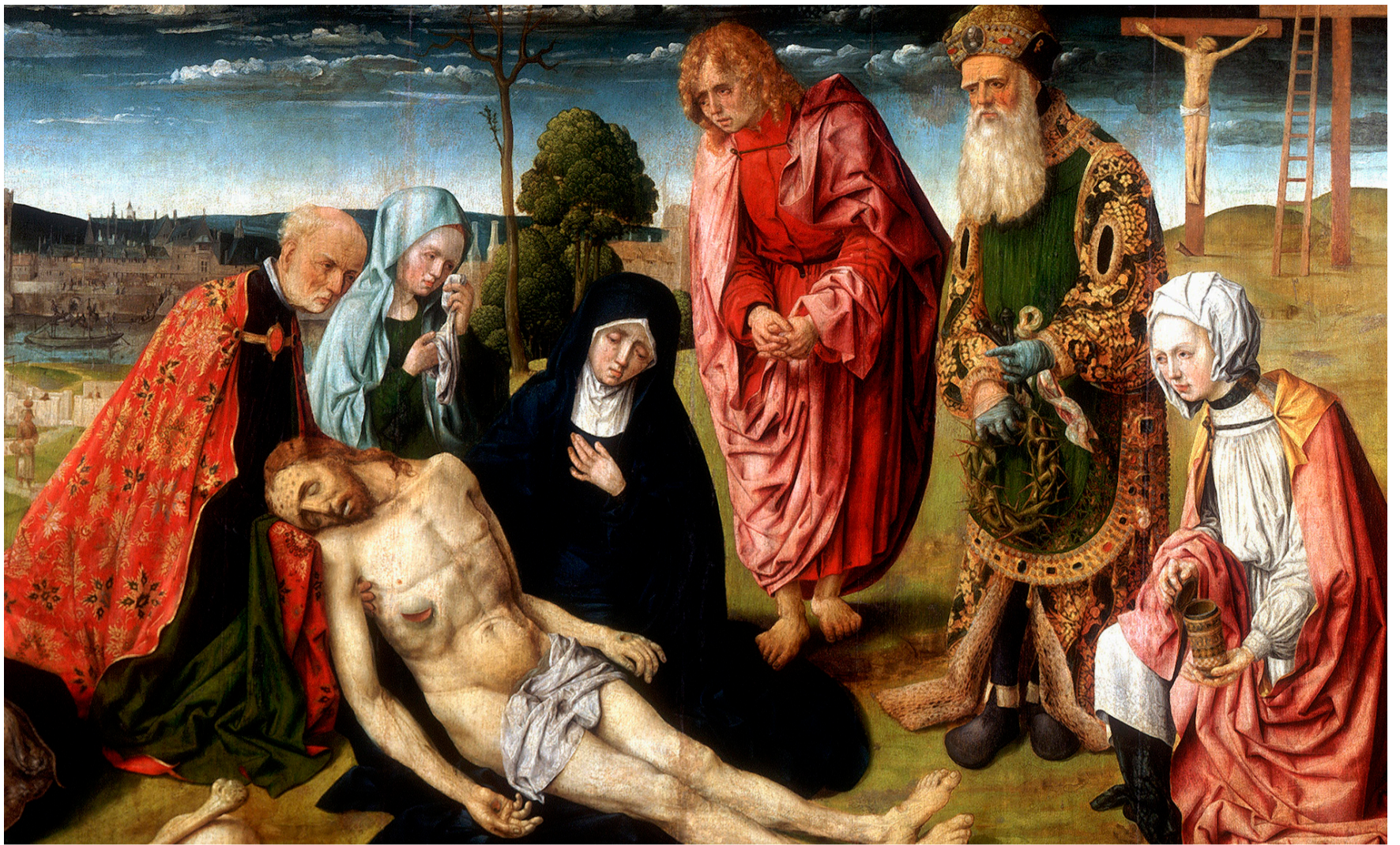
Kotkalaisten muusikoiden Stabat Mater -konsertti kuullaan pääsiäislauantaina Kymin kirkossa.