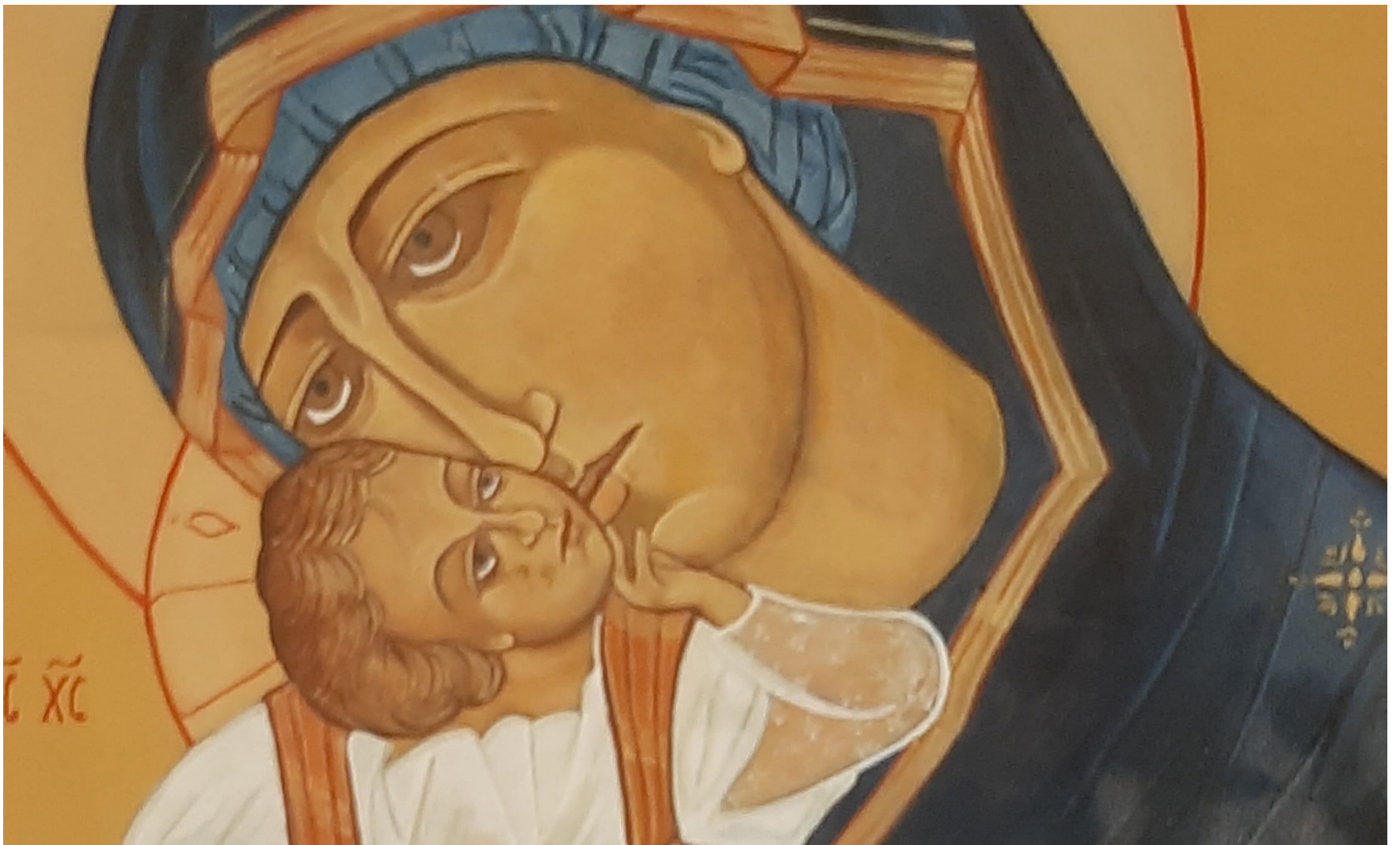
Maria ja Jeesus-lapsi ovat ikonien keskeisimpiä aiheita. Neitsyt Mariaa kutsutaan ortodoksisessa kirkossa nimillä Jumalanäiti ja Jumalansynnyttäjä