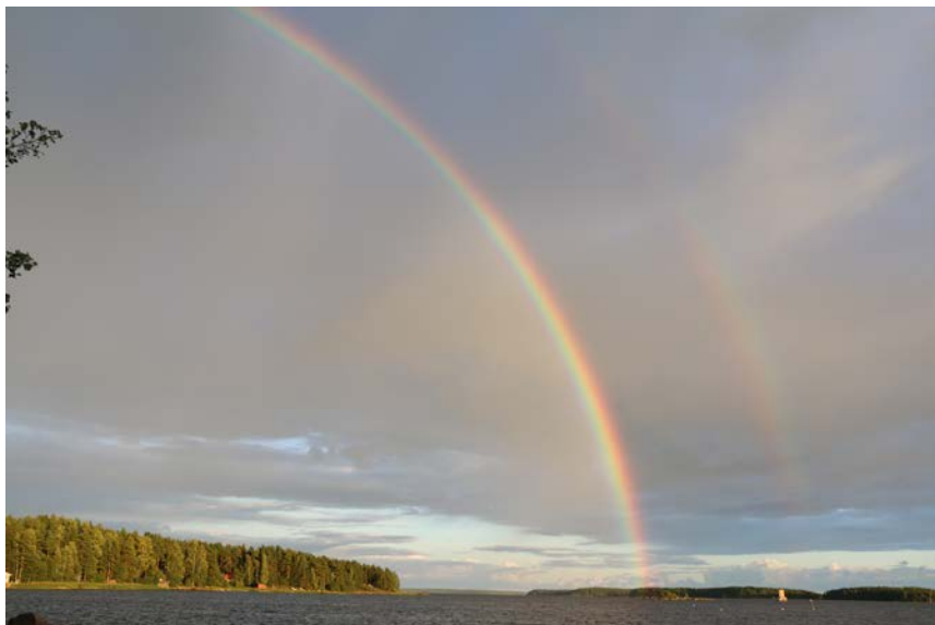
Ei mitään uutta auringon alla, kirjoitti Saarnaaja, ja paljon myöhemmin tämä sanonta tuli tutuksi myös Mika Waltarin kirjasta Sinuhe egyptiläinen.

Kirkonkylän seurakuntatalossa maanantaisin klo 13-15. Tervetuloa viettämään vapaamuotoista yhdessäoloa, kahvikupposen äärelle!