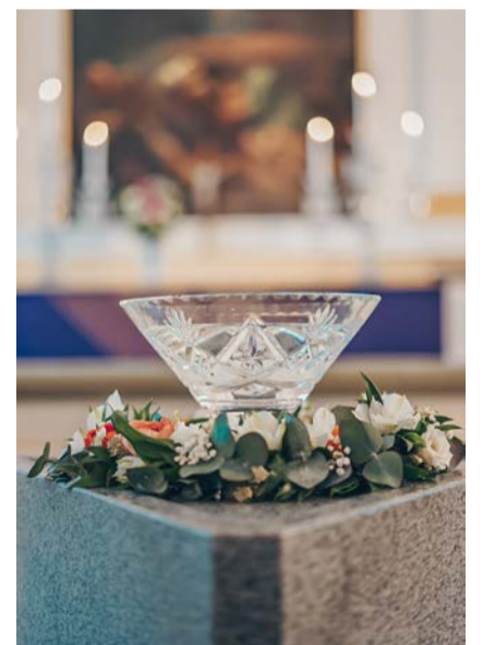
Kastemaljana toimi Tiaisten suvussa kiertävä kastemalja.

– Ehkä rukouksessa? Meillekin on jo iltarukouksesta tulossa hyvä yhteinen hetki.