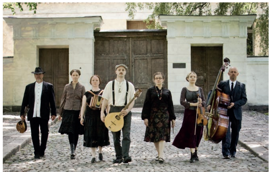
Folk-yhtye Mustarastas esiintyy Kymin kirkossa ti 22.8. klo 18 osana Mielessä tuulee -viikkoa.

Tiistaina 22.8. klo 18 Mielessä tuulee -tapahtumaviikon yhteydessä järjestetään folk-yhtye Mustarastaa konsertti Kymin kirkossa. Yhtyeen musiikissa soi kansanmusiikille tunnusomaiset akustiset kielisoittimet, haitari, viulu, nyckelharpa, basso ja tinapilli. Myös moniääninen laulu on erittäin vahvaa. Yhtye valittiin Kaustisten folkmusic -festivaalien juhlayhtyeeksi 2002.