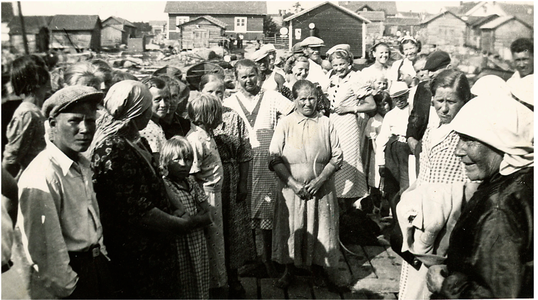
Vielä 1930-luvulla saarissa oli merkittävä tapaus, kun laiva saapui laituriin. Kuvassa Tytärsaaren väkeä vastaanottamassa Oiva-laivaa.