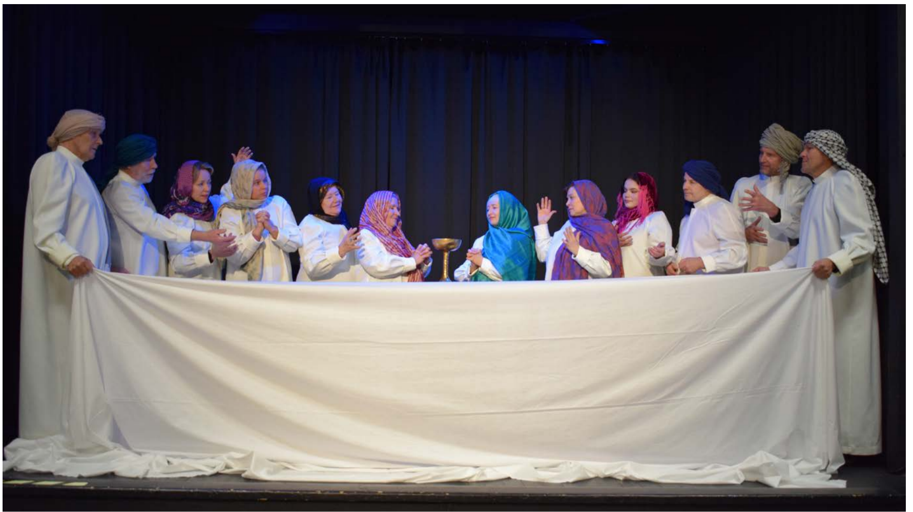
Teatteriryhmä Kimara esittää Ristin tiellä -kärsimysnäytelmän Kotkassa hiljaisella viikolla.